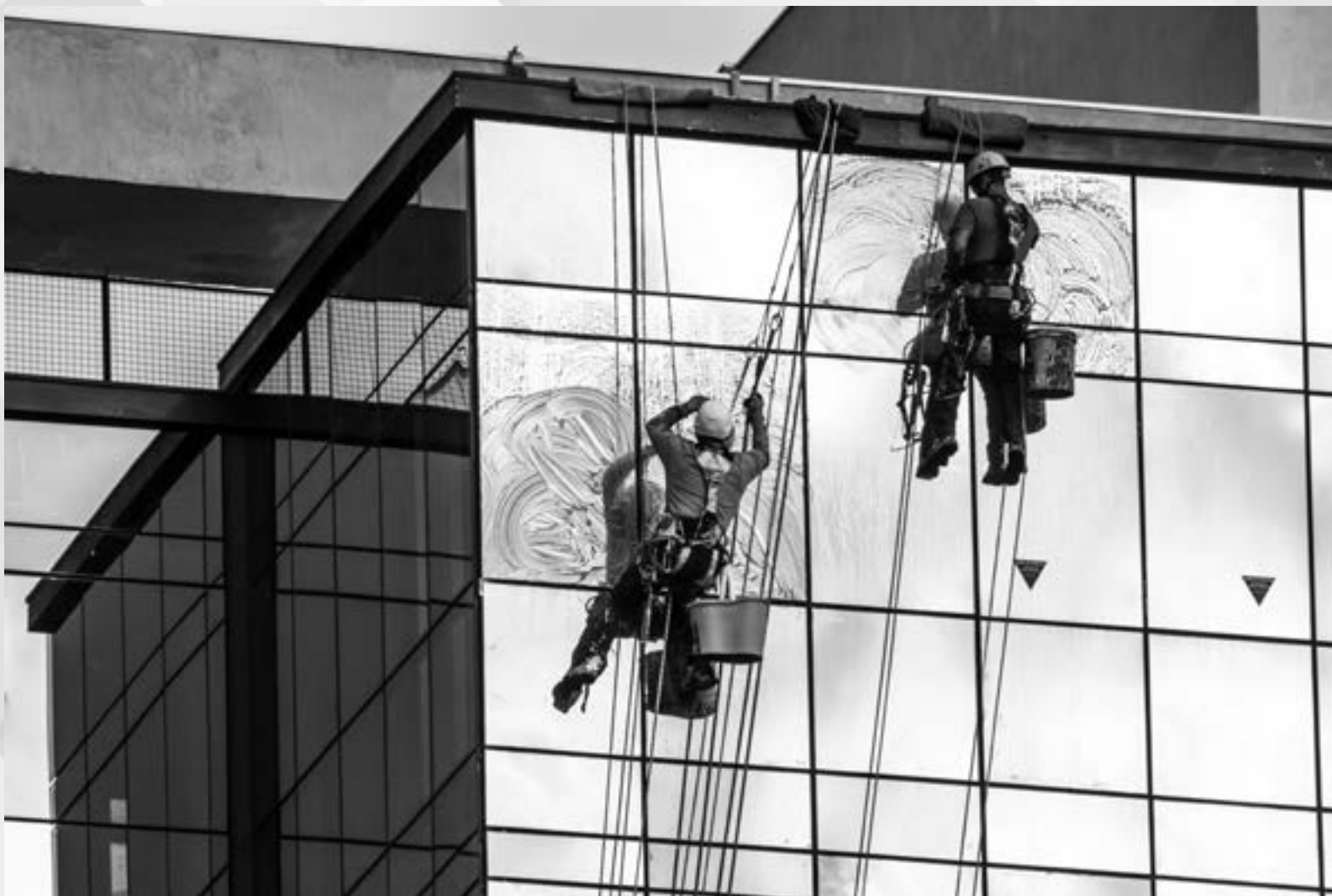
SEM TÍTULO | Autor: Roberto Martinez Duarte Local: Bairro São Geraldo