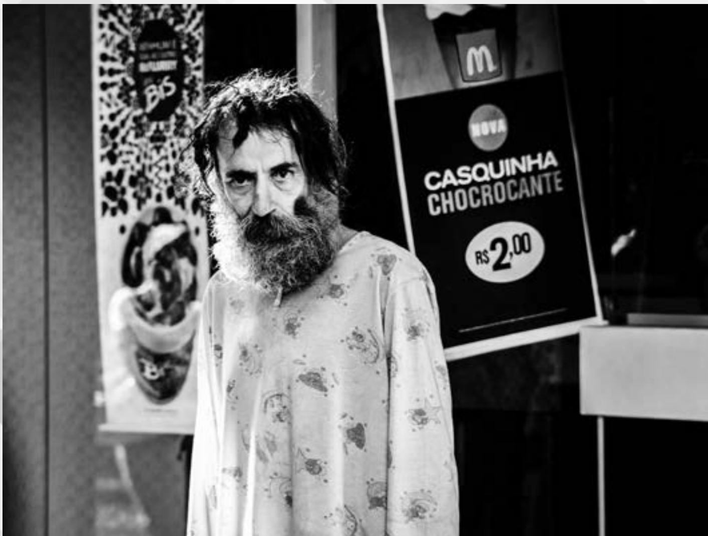
CASQUINHA CROCANTE | Autor: Germano Preichardt Local: Rua dos Andradas