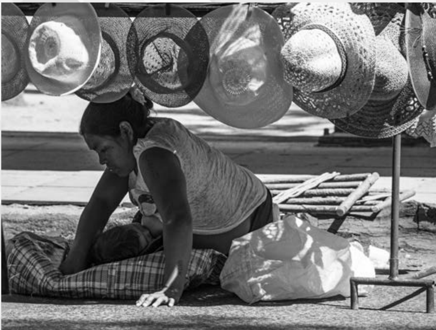
SUPER MÃE | Autor: Jorge Diehl Local: Parque da Redenção