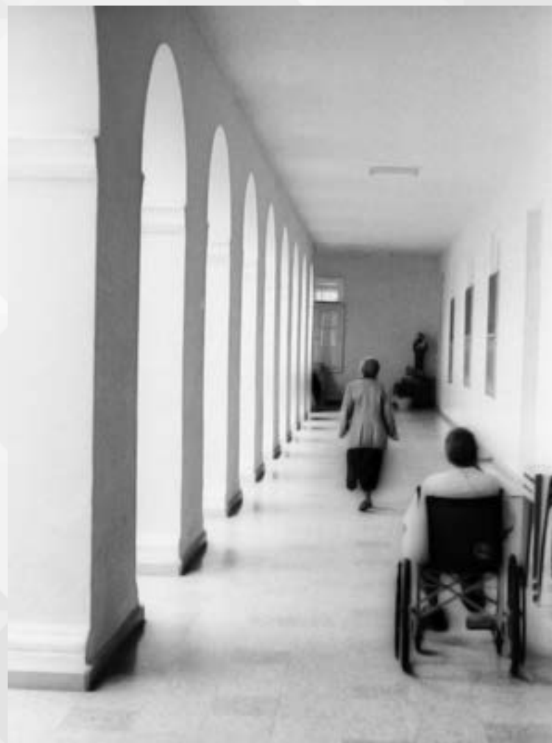
O CORREDOR DA VIDA | Autor: Gutemberg Ostemberg Local: Asilo Padre Cacique