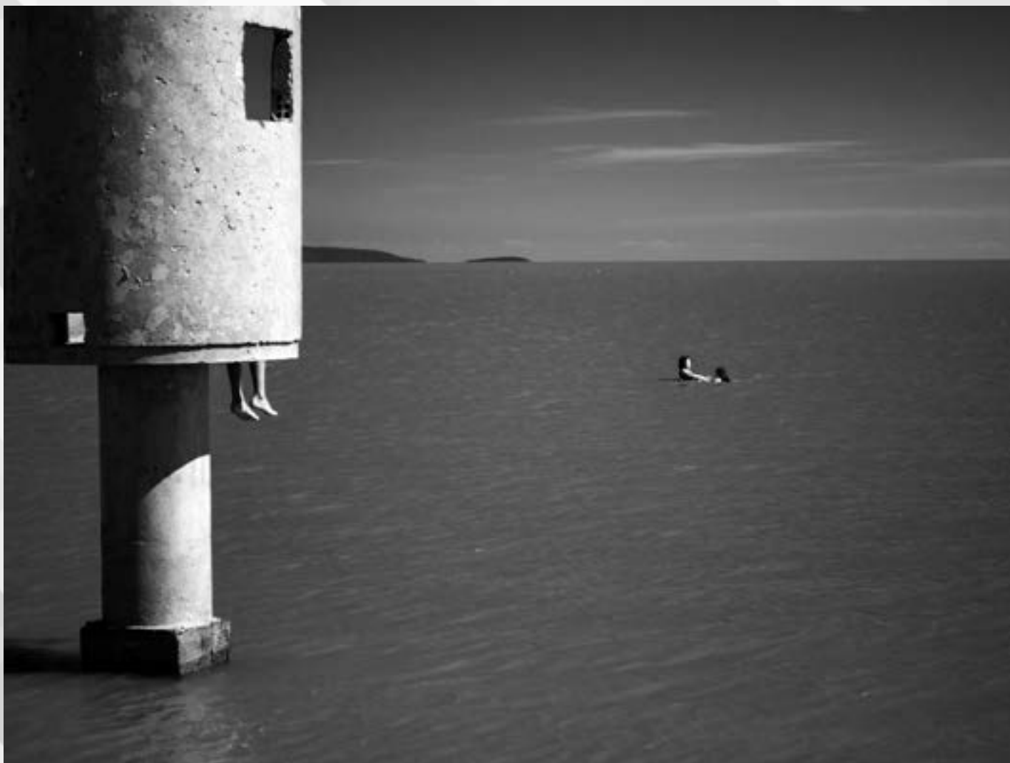
ESCONDIDOS | Autor: Gerson Luis Turelly Local: Praia do Lami