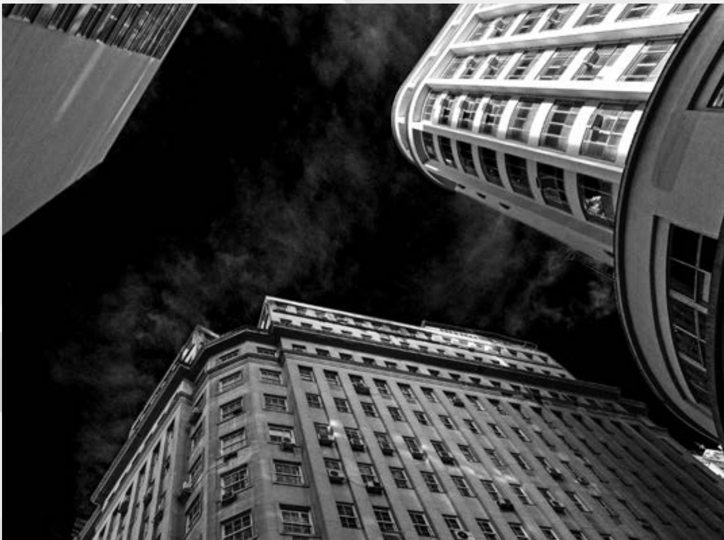
ALTOS DA ESQUINA | Autor: Marcelo Filimberti Local: Esquina entre as Ruas Uruguai e 7 de Setembro