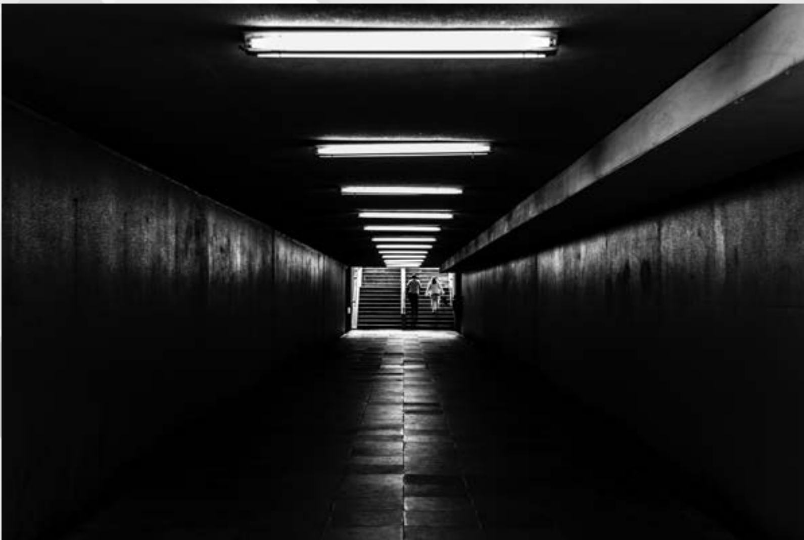
NÃO É CÉU | Autor: Gean Tharcisio Rocha da Silva Local: Estação Hidroviária Centro