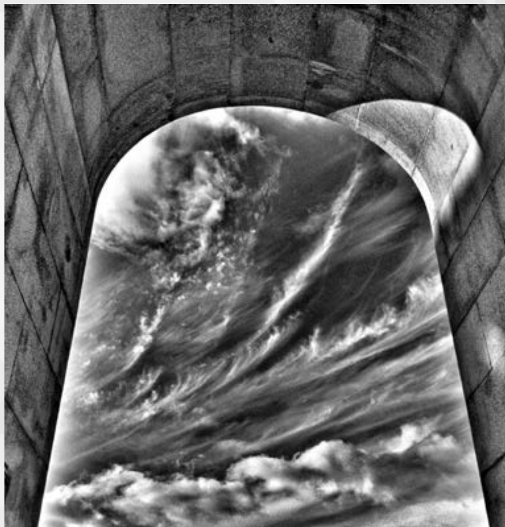
SEM TÍTULO | Autor: Leandro Selister Local: Monumento ao Expedicionário