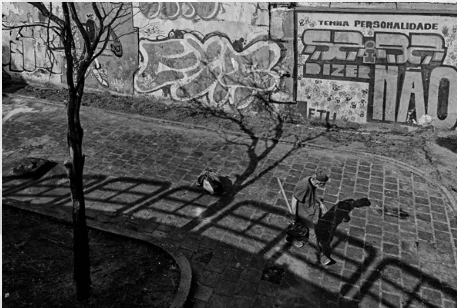
LOUCURAS E RECANTOS | Autor: André Guimarães Antunes Local: Rua da Conceição