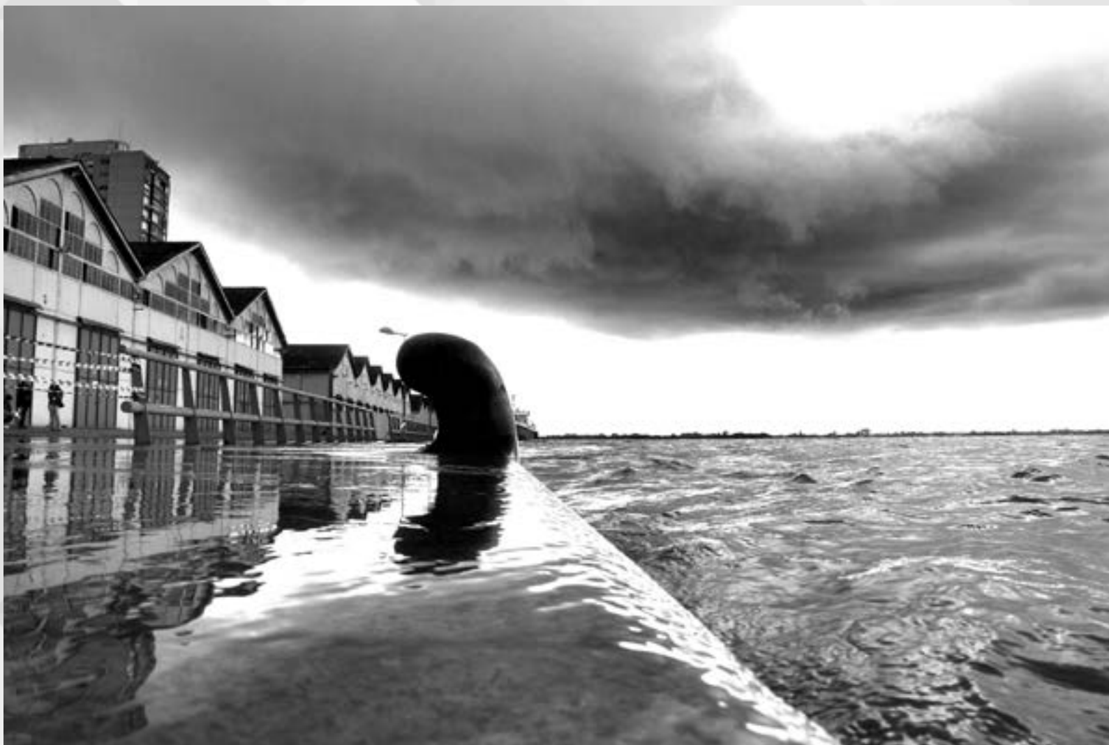
A INVASÃO DAS ÁGUAS | Autor: Mauro Schaefer Local: Cais Mauá