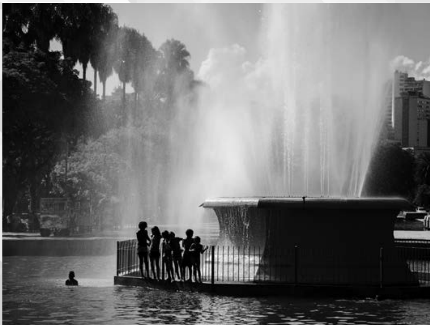
BANHO DE CHAFARIZ | Autor: Santore Renner dos Santos Local: Parque da Redenção