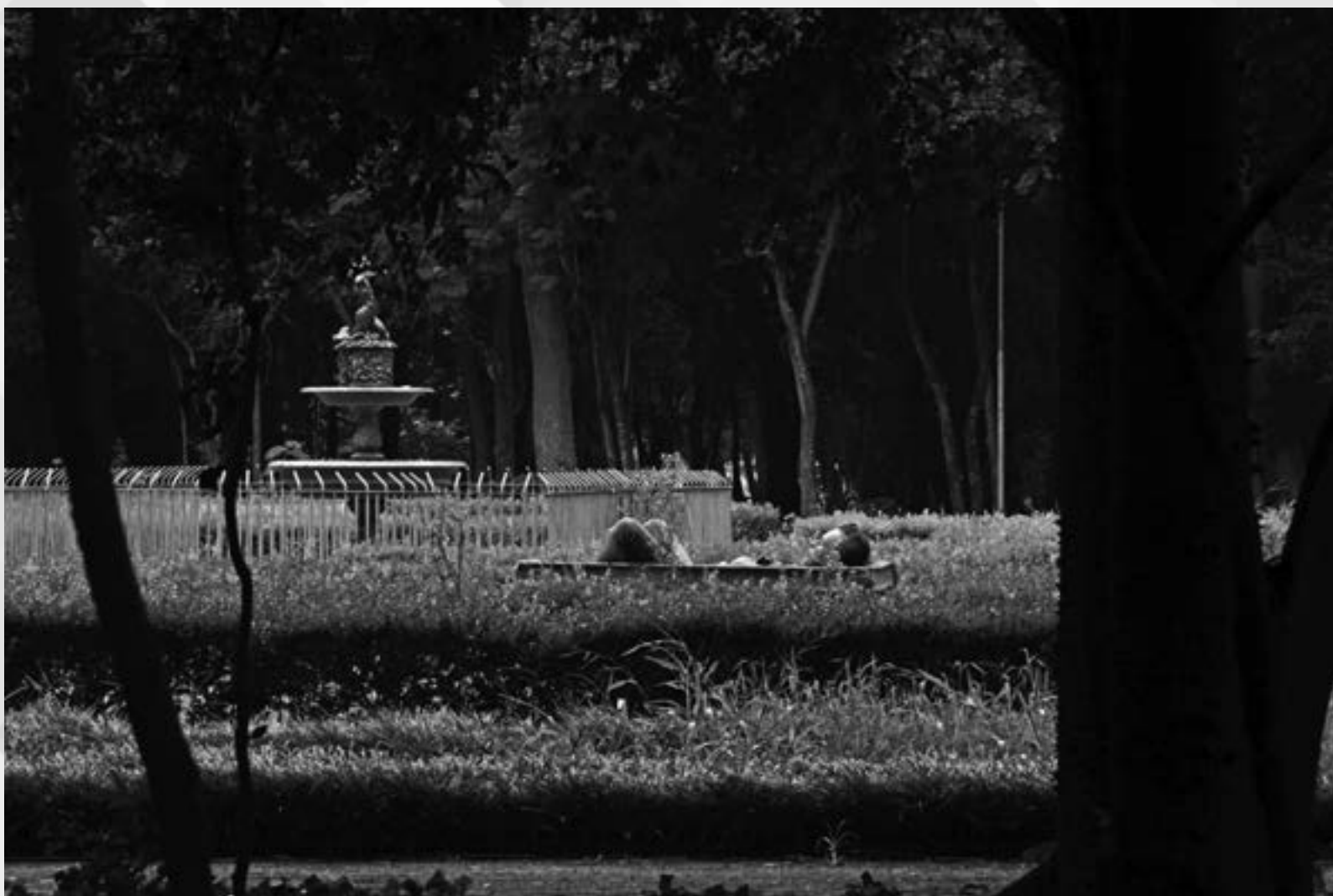
A PORTO ALEGRE INVISÍVEL (NOS SONHOS) | Autor: Cláudio Macedo