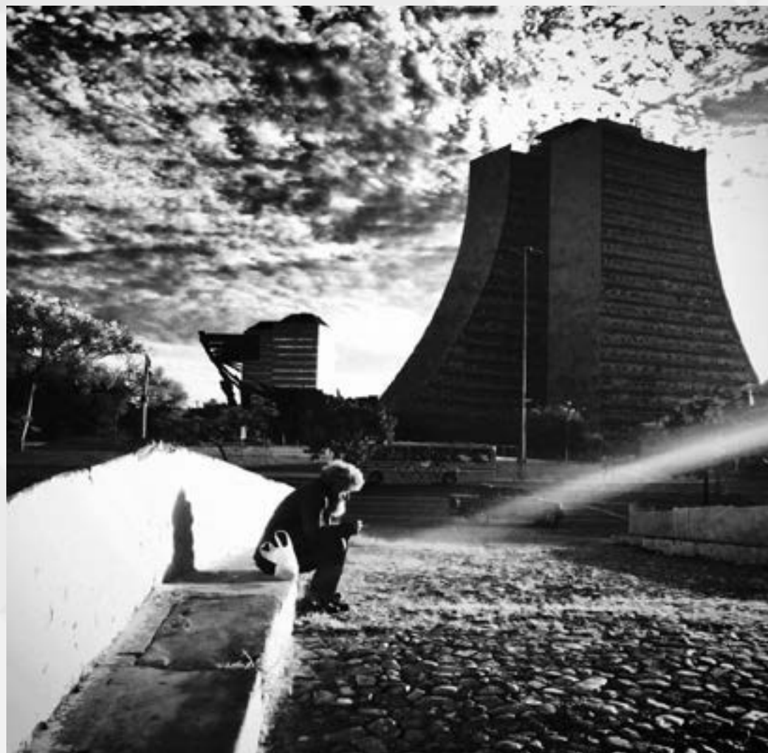
SOLIDÃO | Autor: Heloísa Medeiros Local: Ponte dos Açorianos