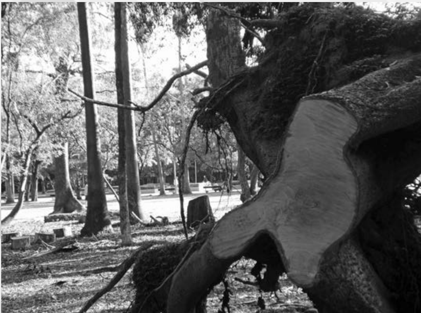
TRONCO E RAIZ: DEPOIS DO TEMPORAL | Autor: Marina Corrêa Lopes Local: Parque da Redenção