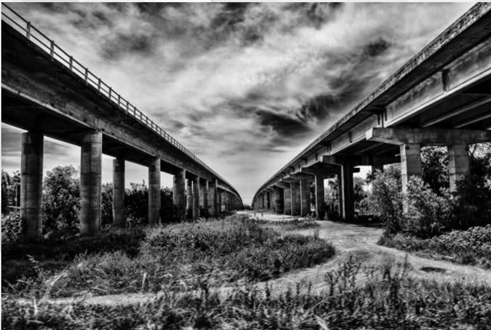
TRANSIÇÕES | Autor: Leonardo Savaris Local: Ilha da Pintada