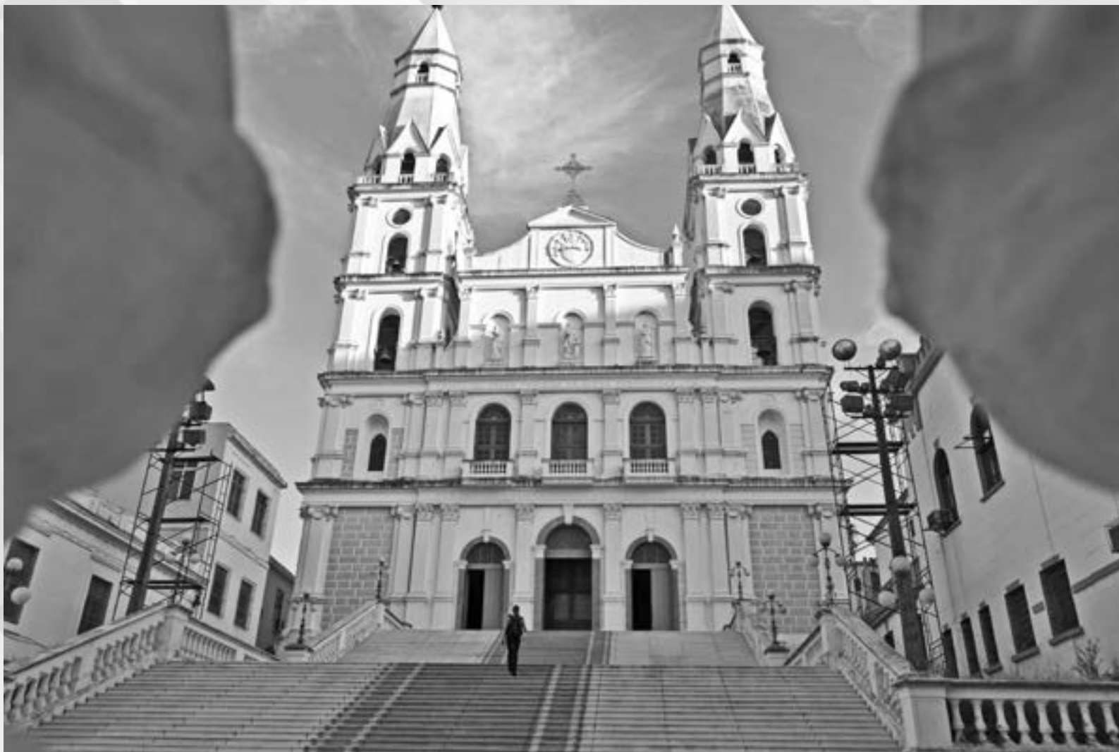
O MURO DAS DORES | Autor: Maria Margot Costa Barcellos Local: Igreja Nossa Senhora das Dores