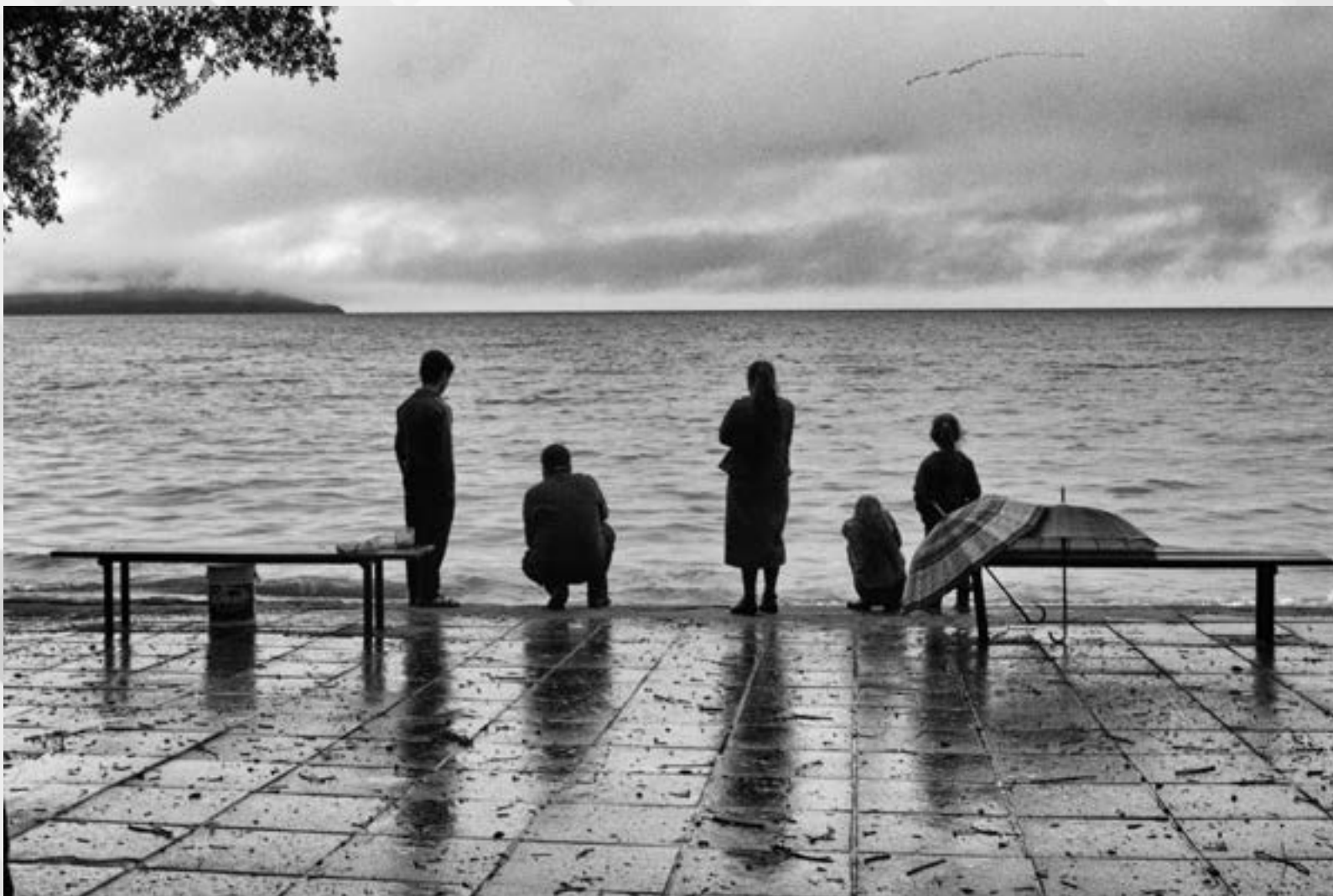
DESOLAÇÃO | Autor: Jane Rosana Cassol Local: Orla de Ipanema