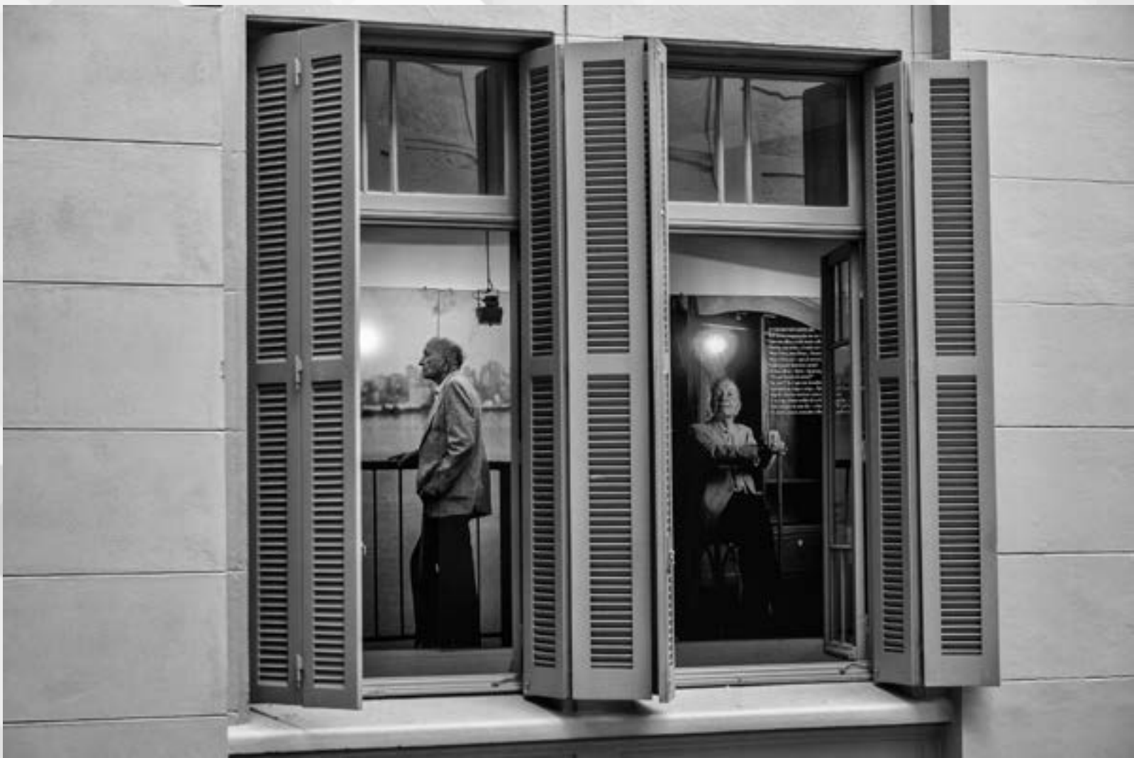
QUINTANA | Autor: Leonardo Savaris Local: Casa de Cultura Mário Quintana