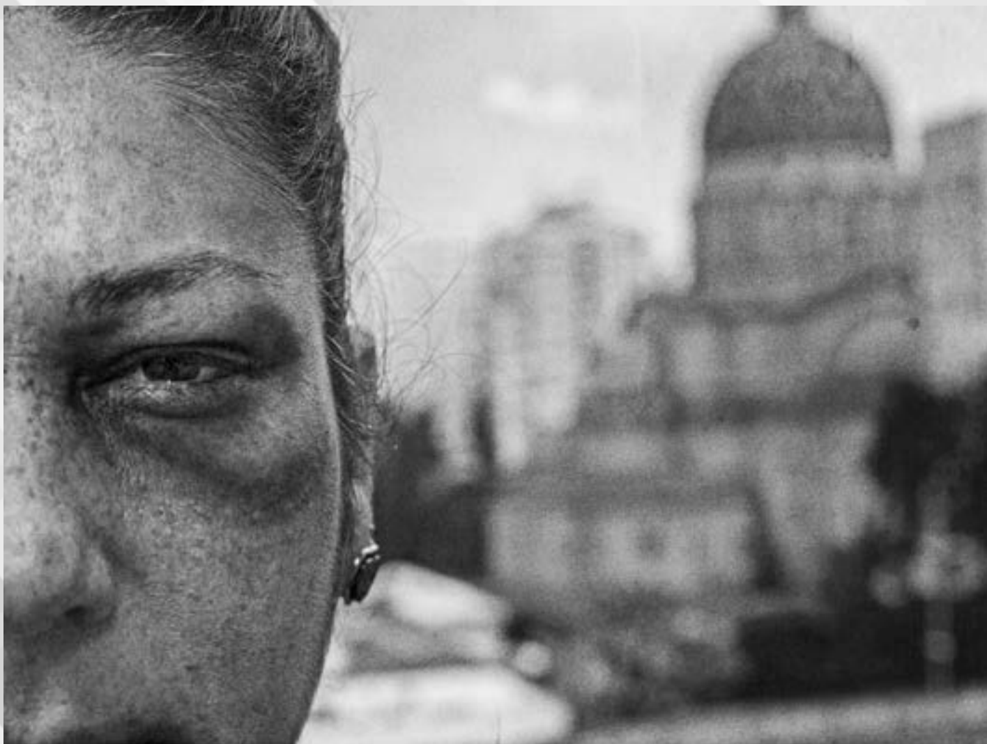
VIOLÊNCIA CONTRA A MULHER | Autor: Daniel Sasso Local: Centro