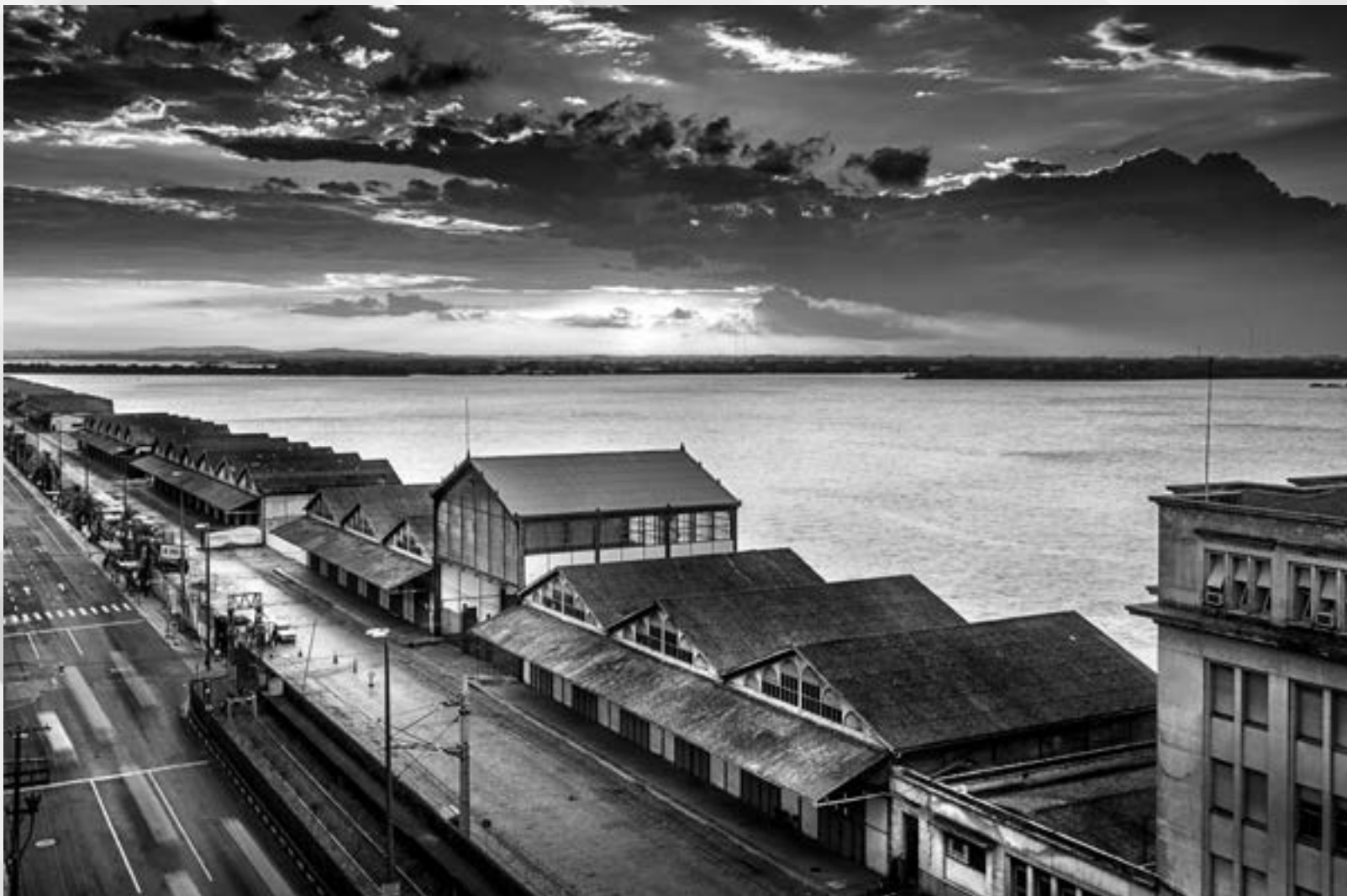
BELEZA OCULTA | Autor: Tiago Alves Antoniazzi Local: Cais Mauá