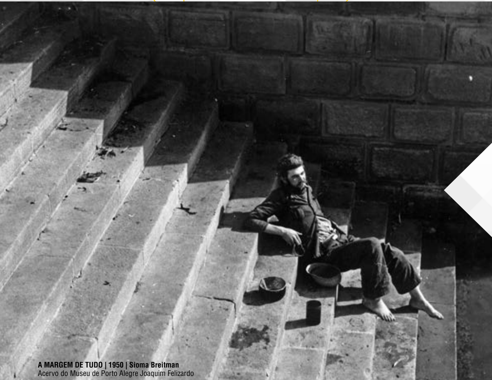
A MARGEM DE TUDO | 1950 | Sioma Breitman Acervo do Museu de Porto Alegre Joaquim Felizardo