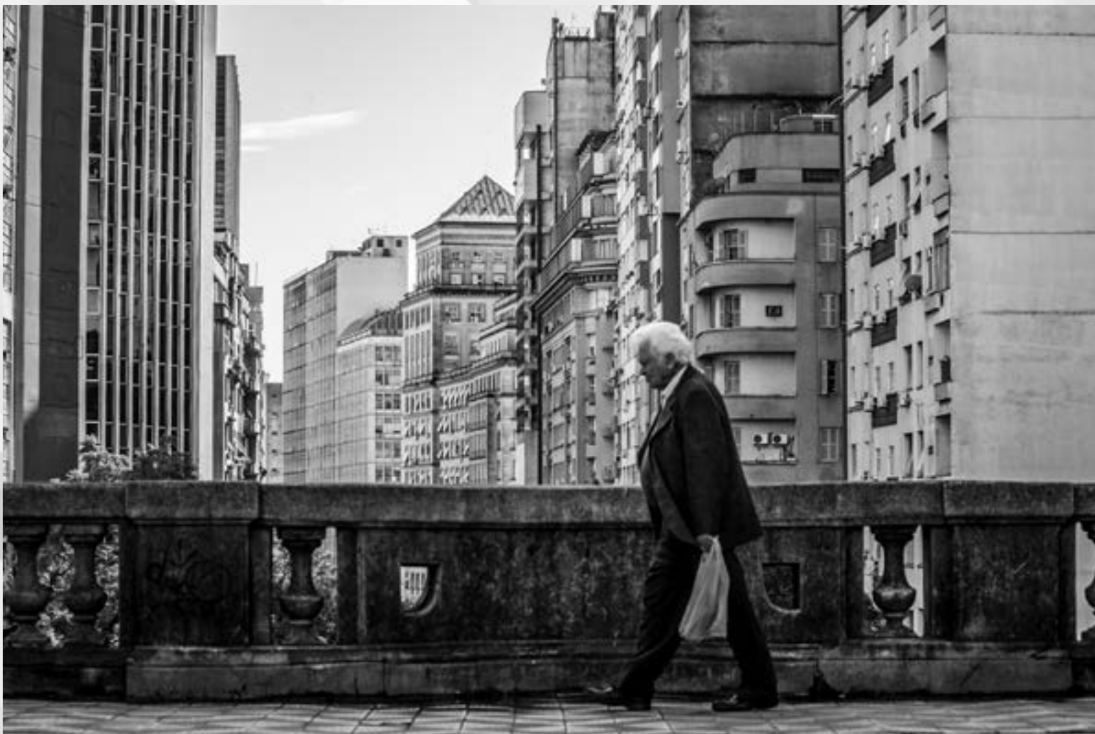
ALÉM DO PONTO | Autor: Pedro Antônio Heinrich Neto Local: Rua Duque de Caxias