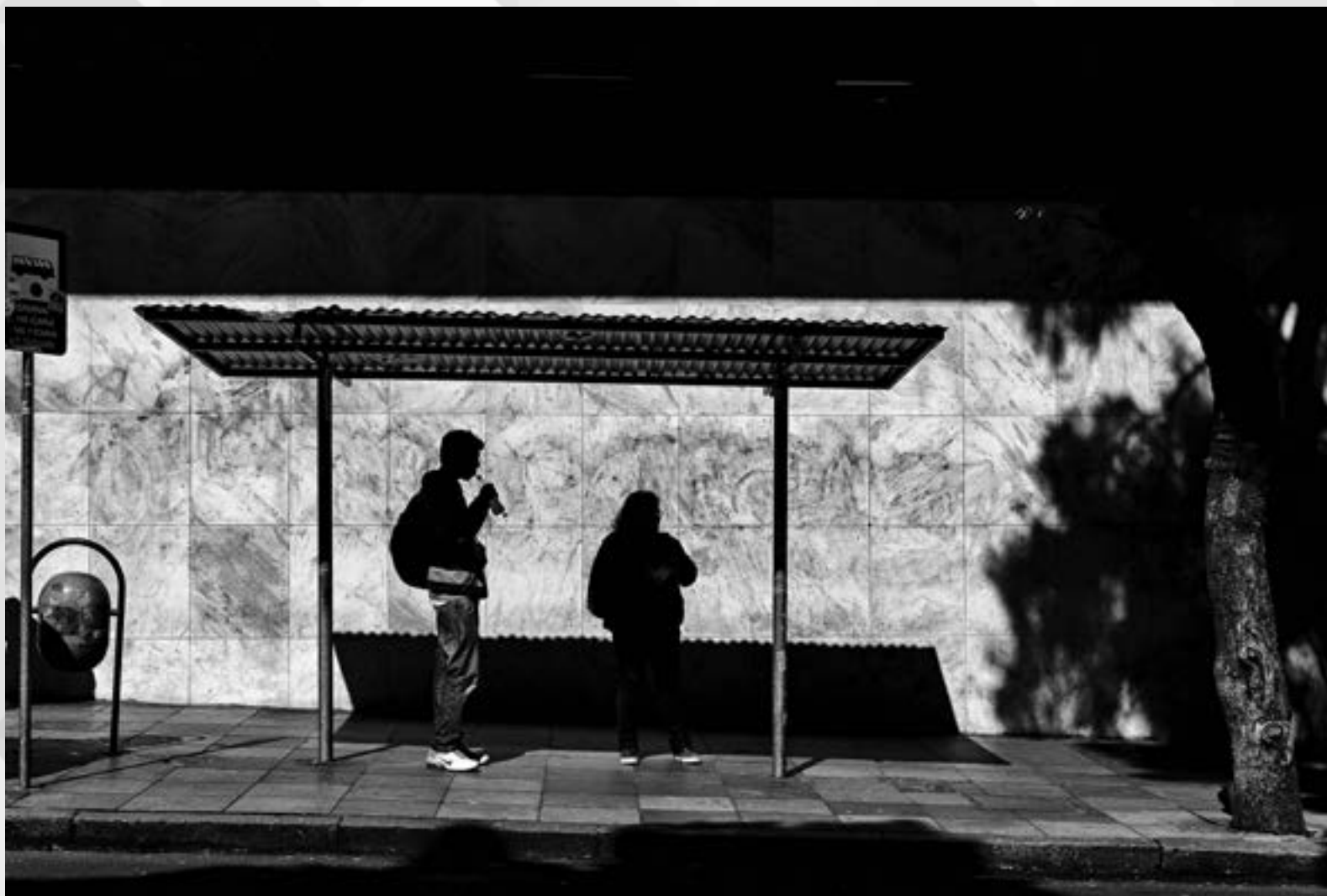
SOMBRAS E SILHUETAS | Autor: André Guimarães Antunes Local: Avenida Senador Salgado Filho