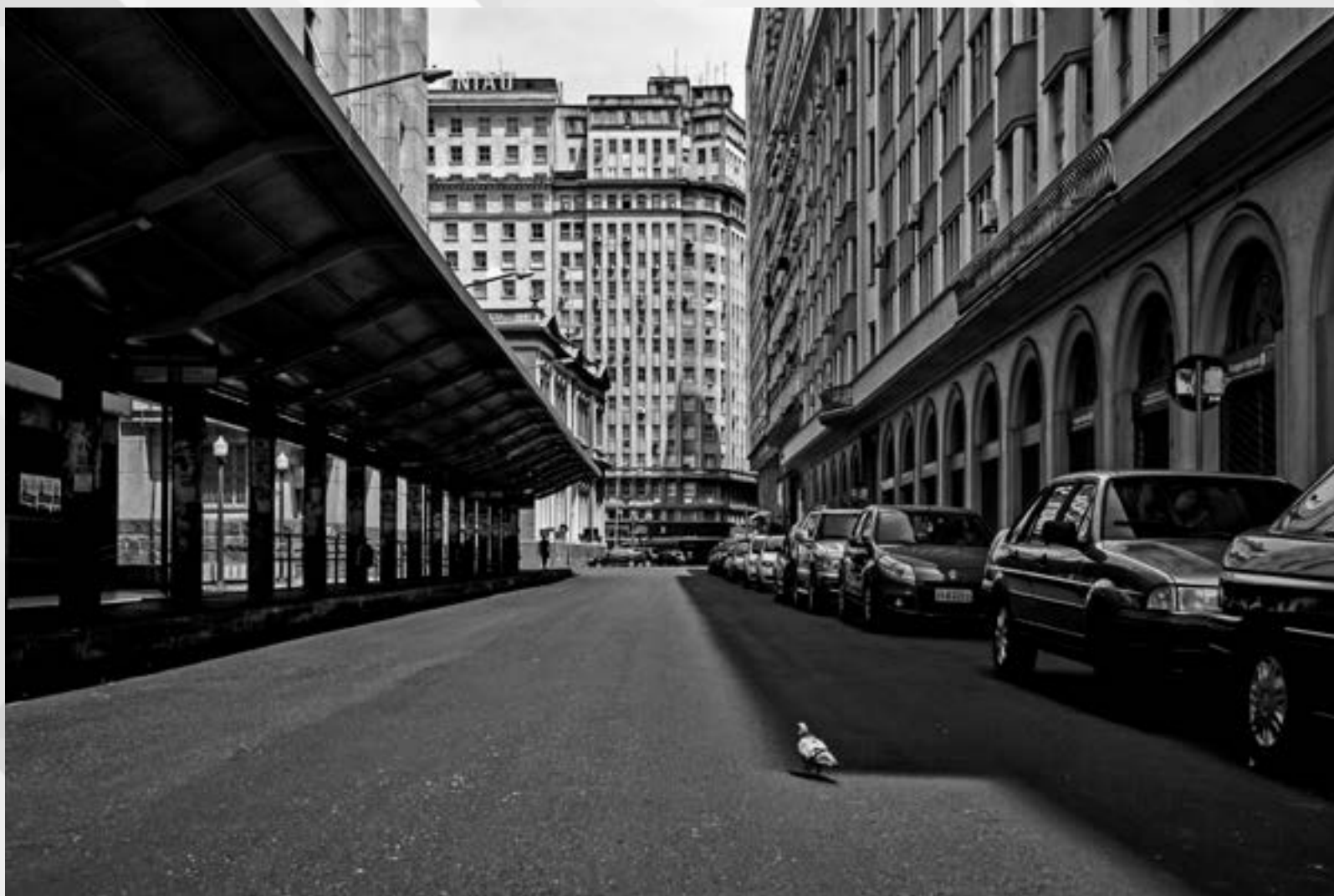
SILÊNCIO | Autor: Leonardo Savaris Local: Rua Uruguai