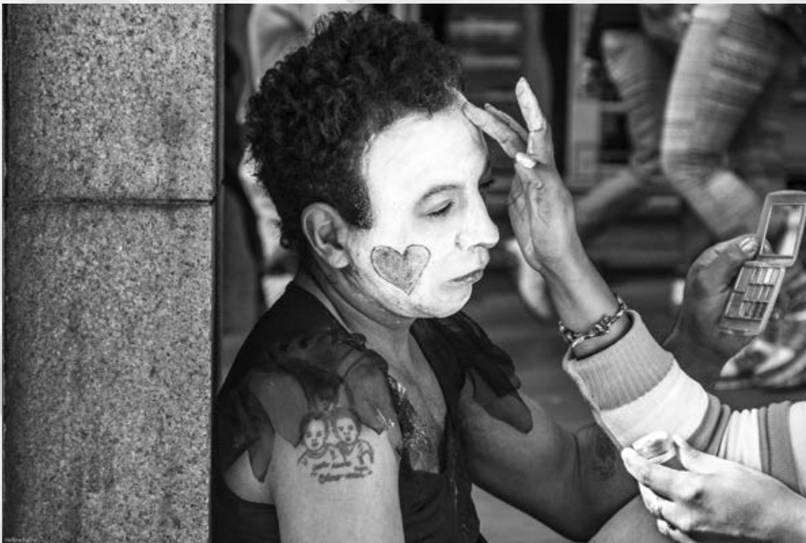
SEM TÍTULO | Autor: Helena Rocha Peixoto Local: Centro