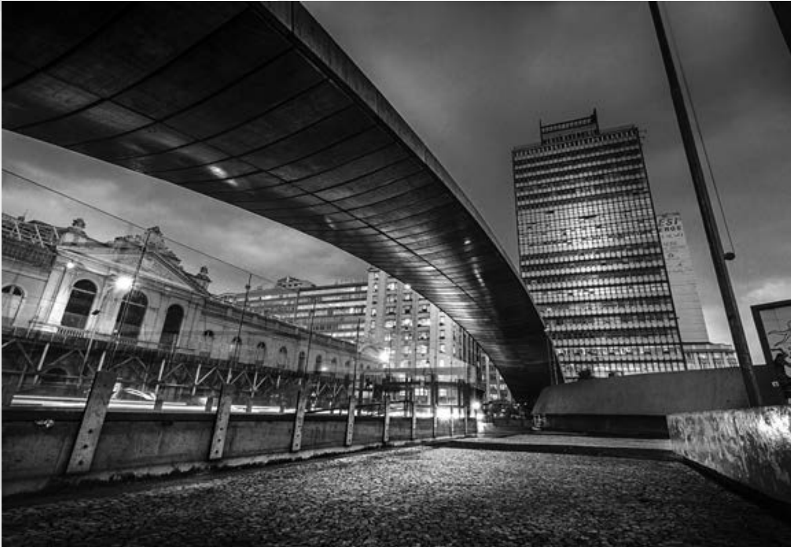
VÃO URBANO | Autor:Tiago Alves Antoniazzi Local: Leonardo Truda