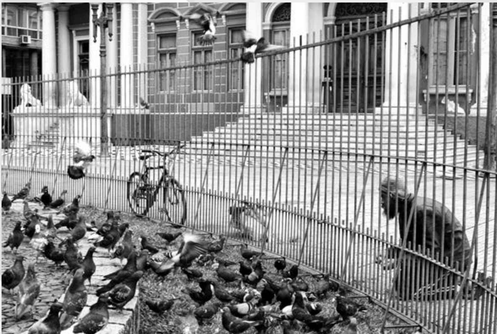
SOLIDARIEDADE | Autor: Jane Rosana Cassol Local: Praça Montevideó