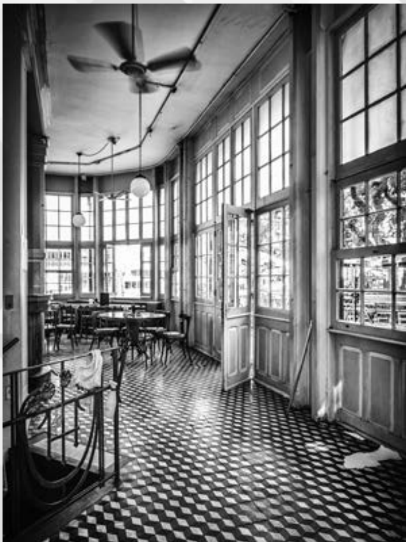
CLIENTELA INVISÍVEL | Autor: Cristiano Wurdig Soares Local: Chalé da Praça XV