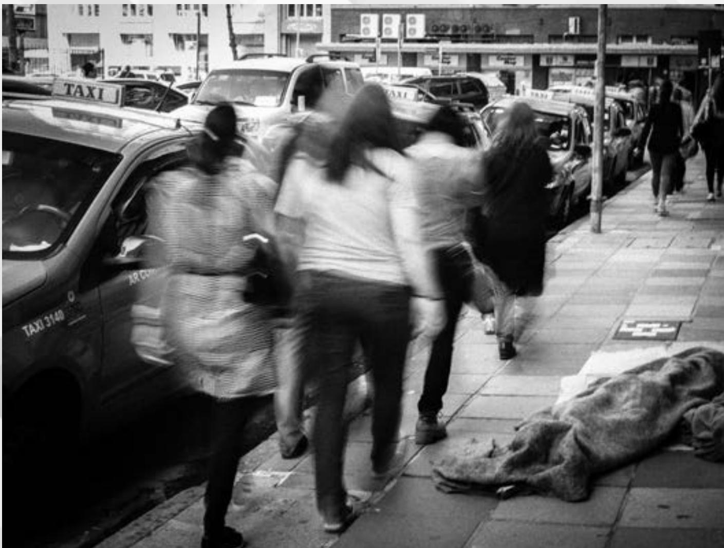
“OBJETO” URBANO? | Autor: Rodrigo dos Santos Monteiro Local: Rua Uruguai