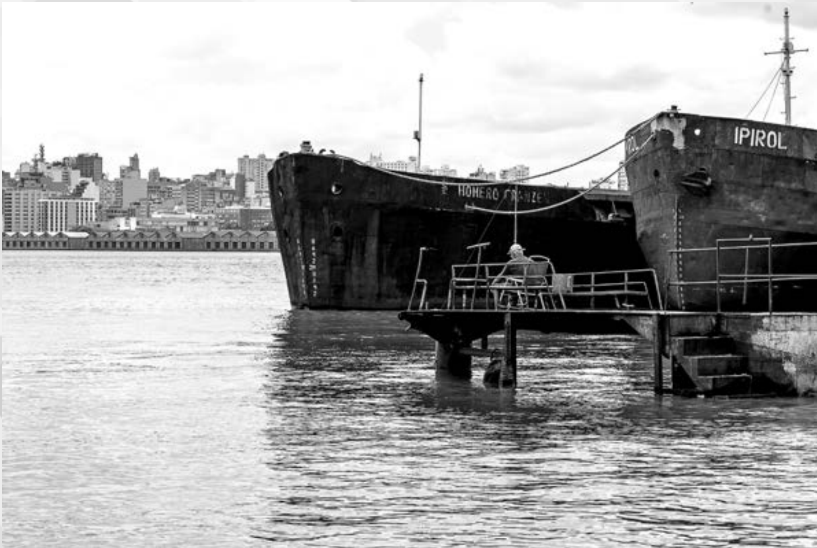
PAZ | Autor: Berenice Fischer Local: Ilha da Pintada