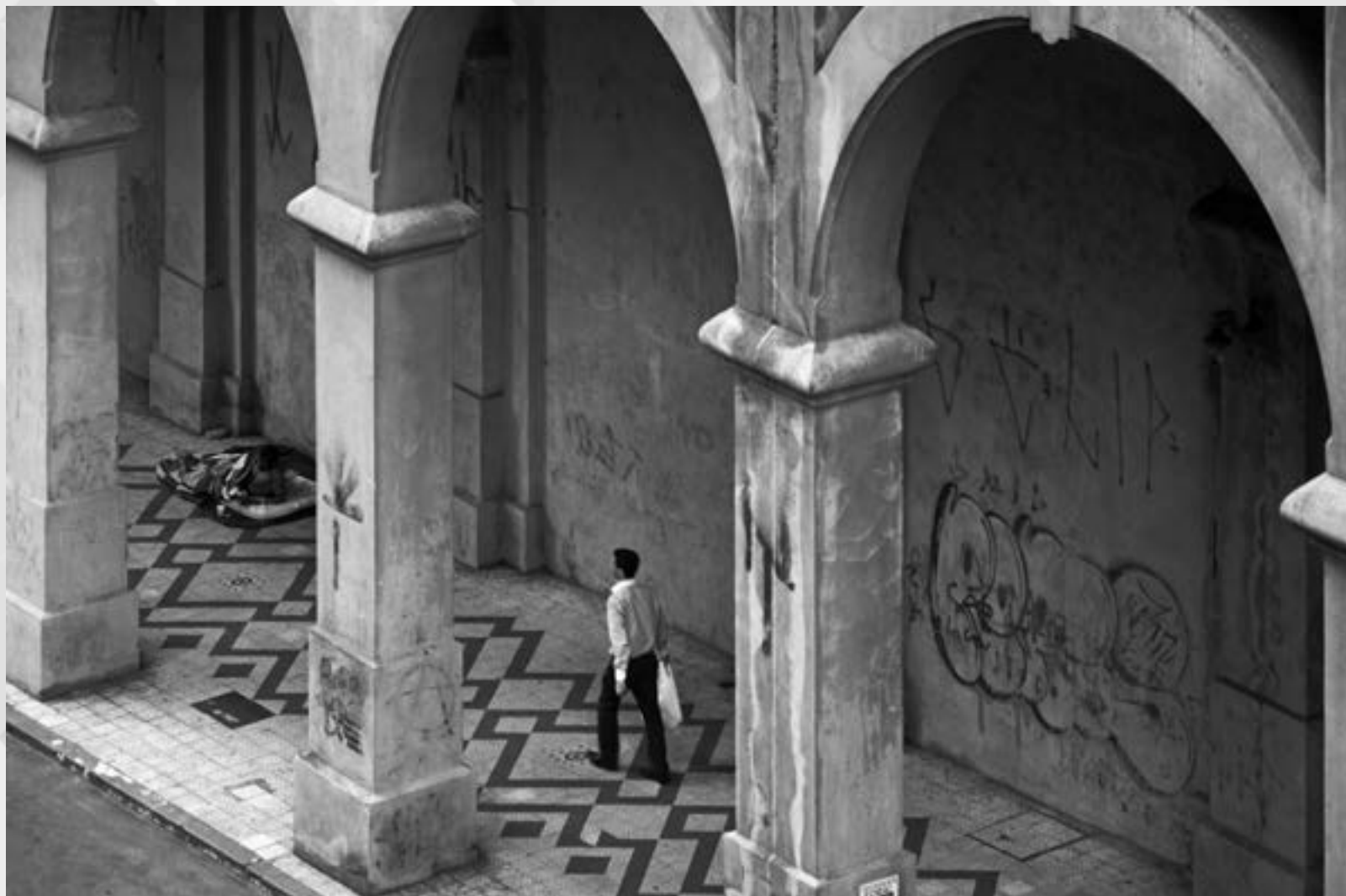
ENTRE PARÊNTESES | Autor: Lorenzo Fantoni Local: Viaduto Otávio Rocha