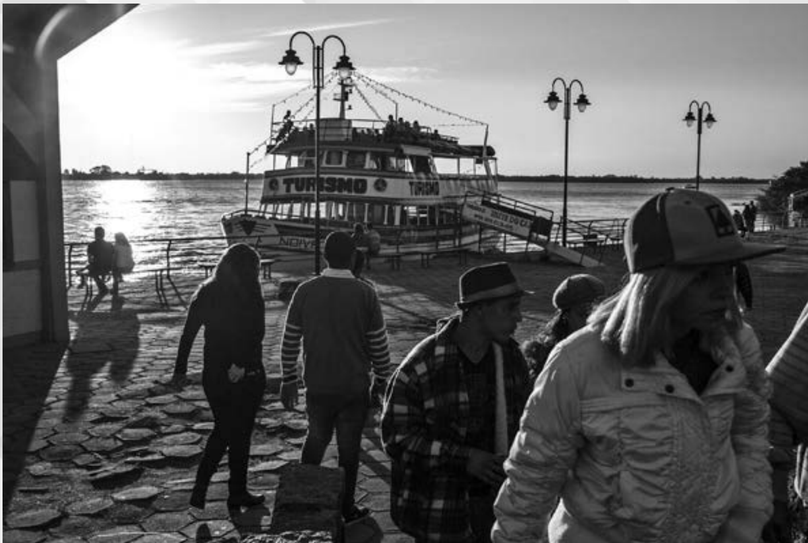
SEM TÍTULO | Autor: Helena Rocha Peixoto Local: Usina do Gasômetro