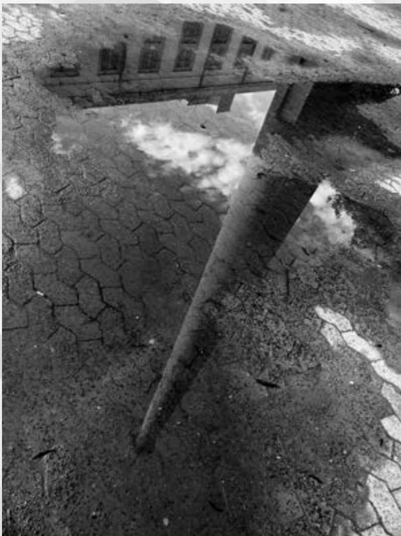
O REFLEXO | Autor: José Benedito de Oliveira Local: Usina do Gasômetro