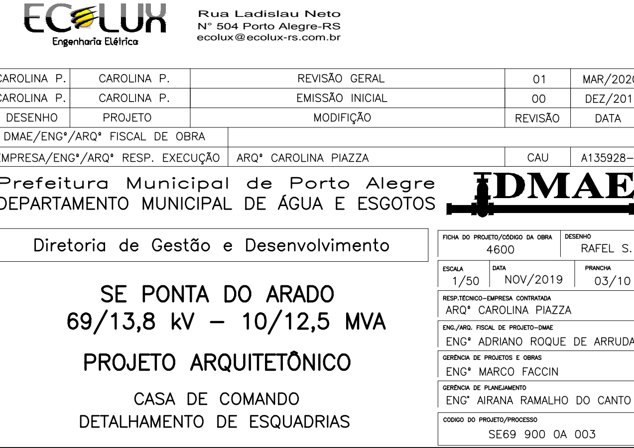
DETALHAMENTO PORTAS DT