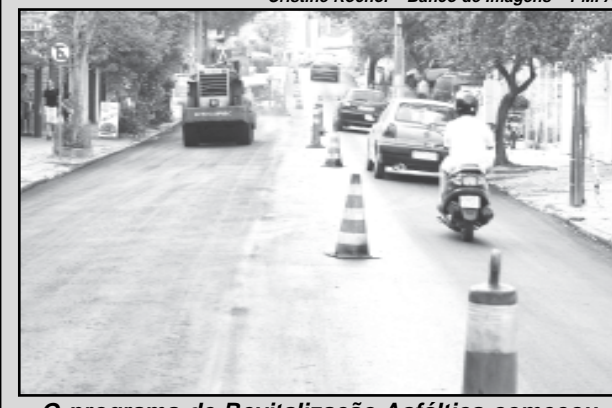
O programa de Revitalização Asfáltica começou em janeiro de 2007