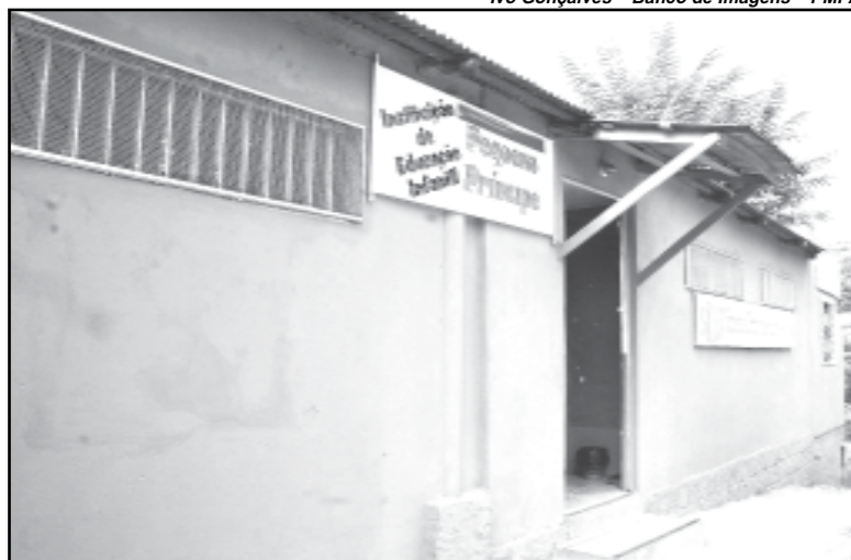
A obra foi conquistada no Orçamento Participativo de 2005

Para o líder comunitário, valeu a pena lutar e preparar-se para administrar a escola, que atende crianças das Vilas Ipê 1 e 2,