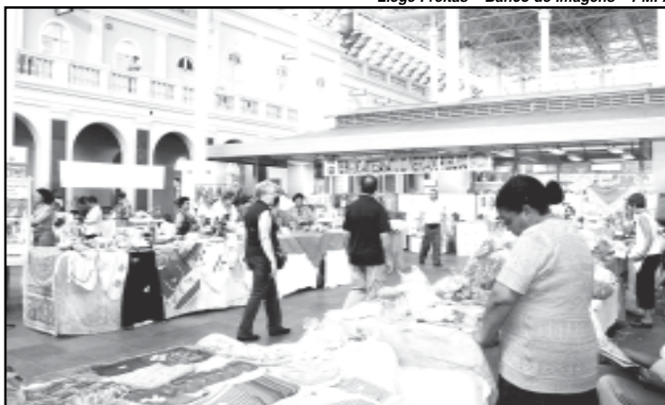
Várias formas de artesanato estão em exposição