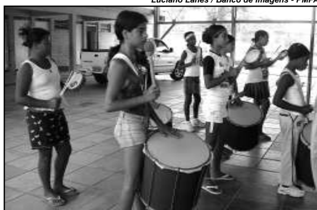
Ensaios dos alunos são realizados nos finais de semana