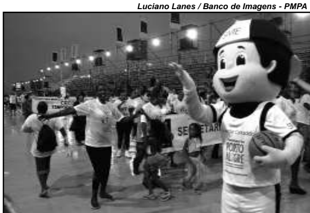
“Rumo a Pequim” é o tema do samba-enredo neste ano