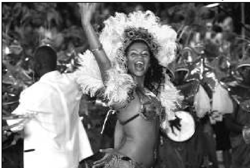
Procempa vai transmitir ao vivo pela Internet