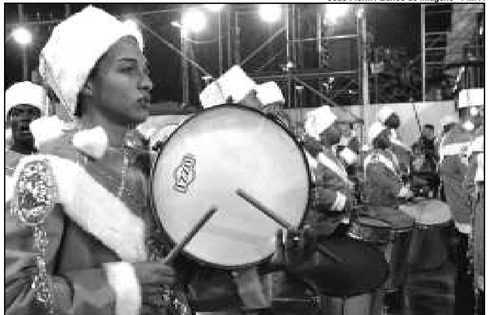
Ingressos serão vendidos no Porto Seco, a partir das 18h