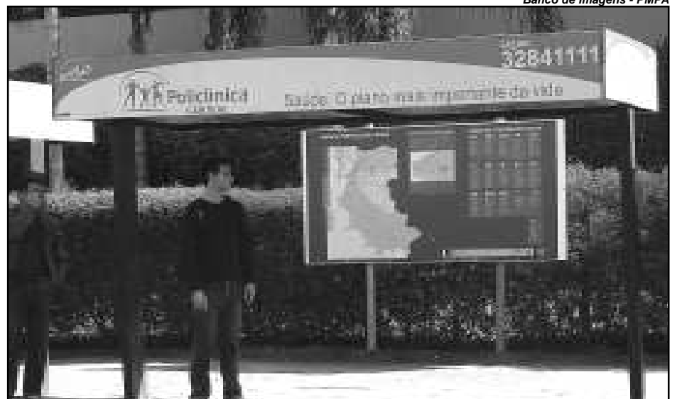
Ônibus terão passe-livre amanhã, 2, até às 4h de domingo