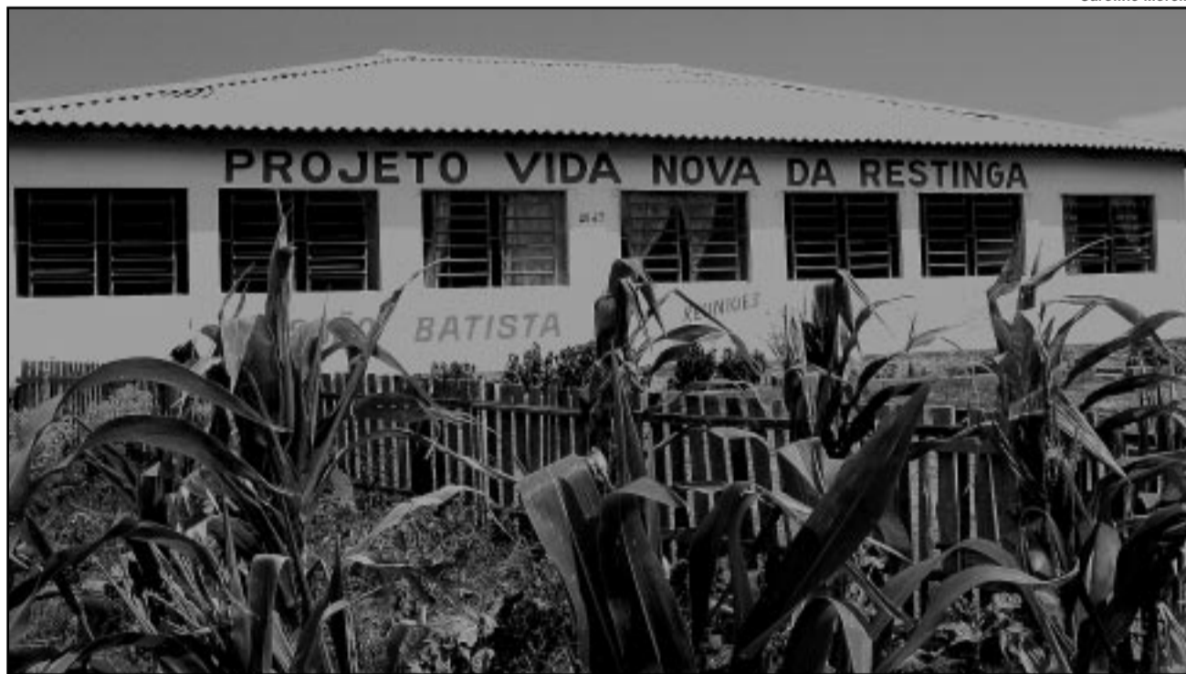
Uma horta para produção de alimentos já foi implantada pelos moradores