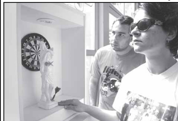
Jovens puderam explorar as obras

Textos elaborados e de responsabilidade da Assessoria de Comunicação da Câmara