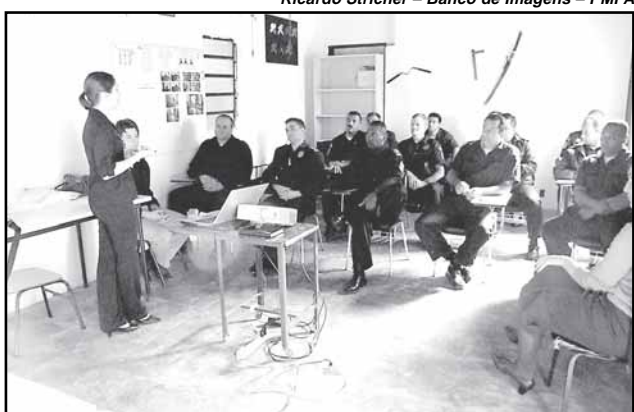
Encontro abordou aspectos históricos do patrimônio cultural e natural

Com duração de duas horas, a palestra foi dirigida pela equipe do Serviço de Atenção ao Turista da Secretaria Municipal de