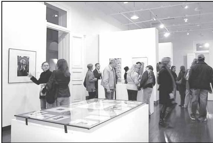
A pinacoteca Aldo Locatelli foi reaberta dia 19 de setembro