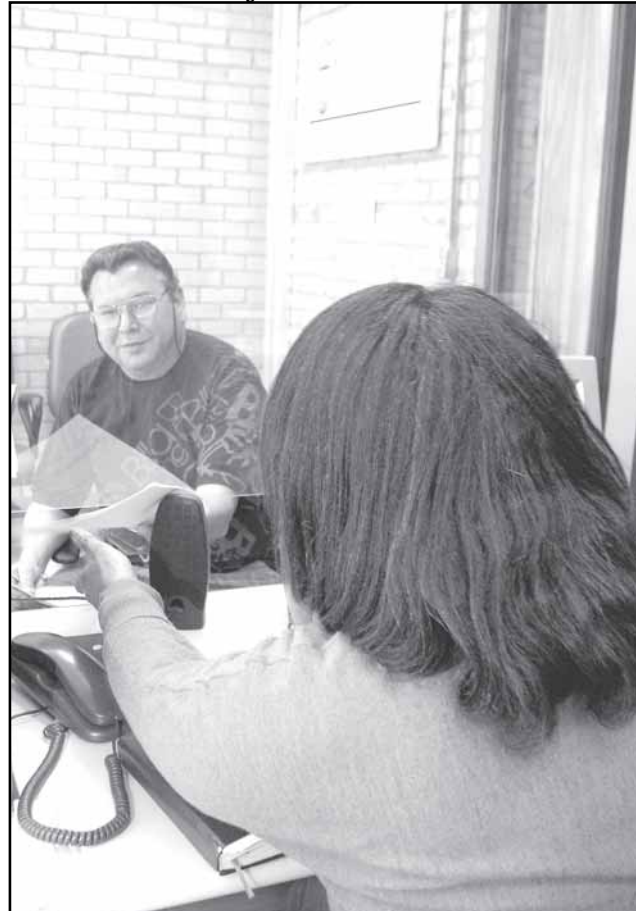
A prefeitura está fazendo a entrega do licenciamento em regime de plantão, sem fechar ao meio-dia