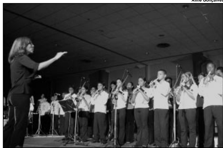
Orquestra de Flautas conta atualmente com 55 componentes de 12 a 21 anos

A Orquestra, que possui atualmente 55 componentes de 12 a 21 anos, vai abrir a sessão plenária com o Hino Nacional e encerrá-la com a música Aquarela do Brasil, de Ary Barroso.