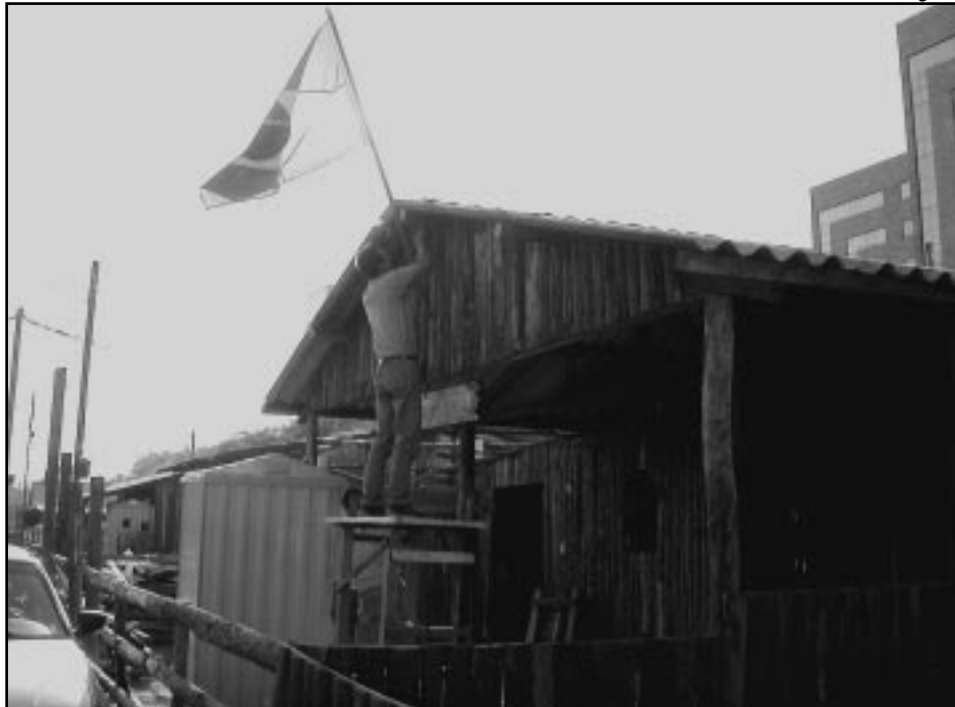
Tradicionalistas trabalham na montagem dos piquetes