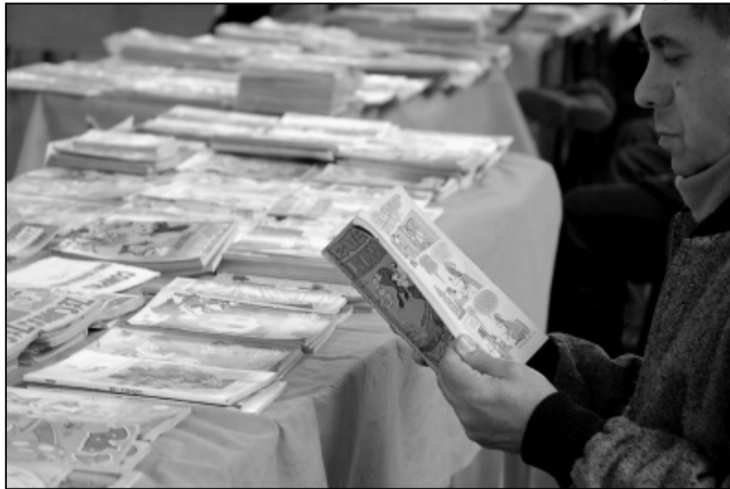
Feira está no calendário de eventos da cidade