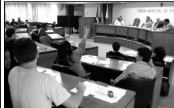
Alunos apresentaram cinco projetos