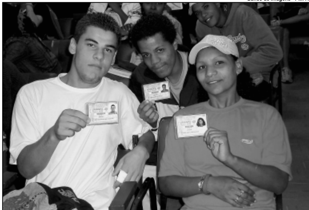
Carteira permite a compra de passagem escolar