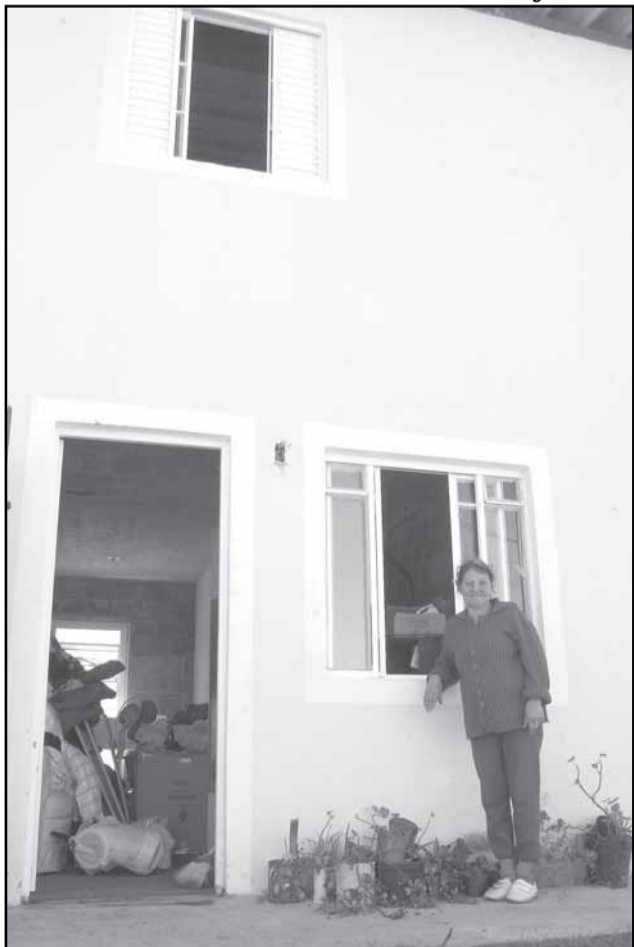
...e tomou posse da moradia 92 no Campos do Cristal