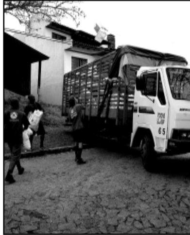
Coleta seletiva será ampliada

O projeto prevê novidades como a varredura mecanizada das principais vias de Porto Alegre e corredores de ônibus, ampliação dos roteiros e área de abrangência da coleta seletiva (apenas dez bairros têm esse tipo de coleta duas vezes por semana e 74 contam com esse sistema uma vez por semana), além de limpeza de monumentos e pichações e lavagem e desinfecção diária das imediações do Mercado Público.