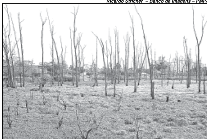
Parque Mascarenhas possui áreas de lazer e de preservação

Primeiro parque originado da Lei de Parcelamento de Solos, o Mascarenhas possui áreas de lazer e recreação e também de preservação permanente. Localiza-se na Rua Aloísio Filho, 570, Bairro Humaitá. Na área de banhado foi feito um aterro sanitário com lixo doméstico para permitir a