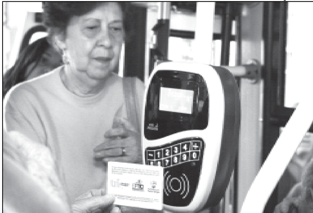
Bilhetagem eletrônica já está presente em todos os ônibus da Capital