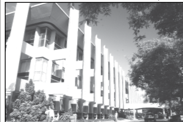
Fachada da CMPA