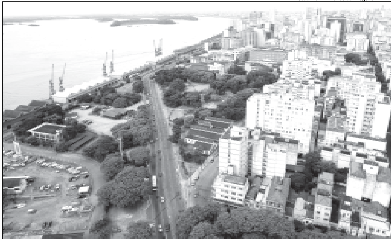
Pisa elevará índice de tratamento de esgotos de 27% para 77%