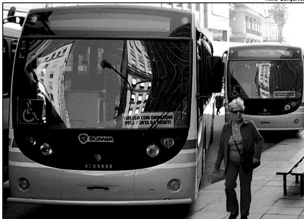
Empresa é a primeira instituição do segmento de transporte a ser reconhecida