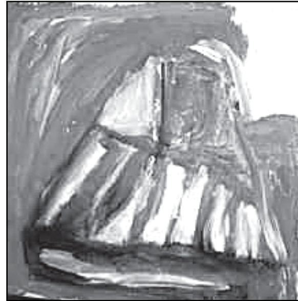
Uma das fotos da mostra