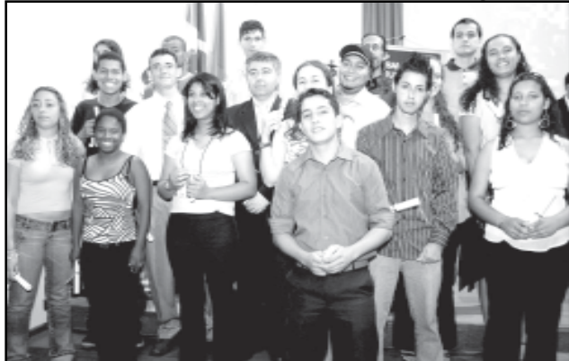
Programa já preparou, neste ano, 917 jovens para o mercado de trabalho