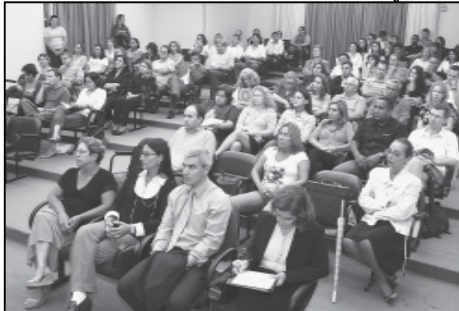
Primeira turma de pós-graduação tem 60 alunos