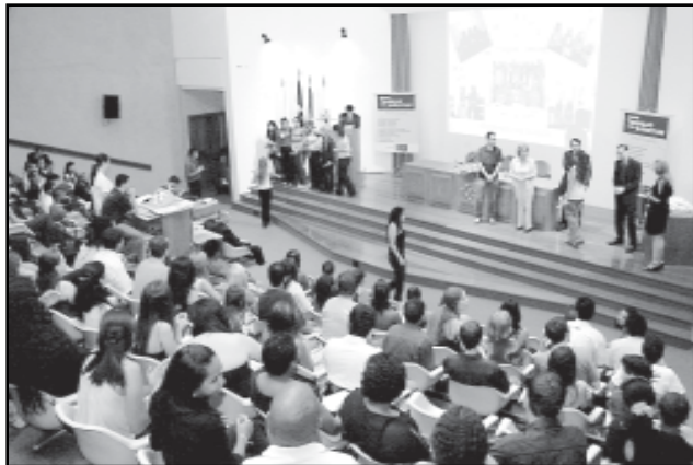
Na sexta-feira, mais 352 jovens concluíram os cursos de qualificação profissional