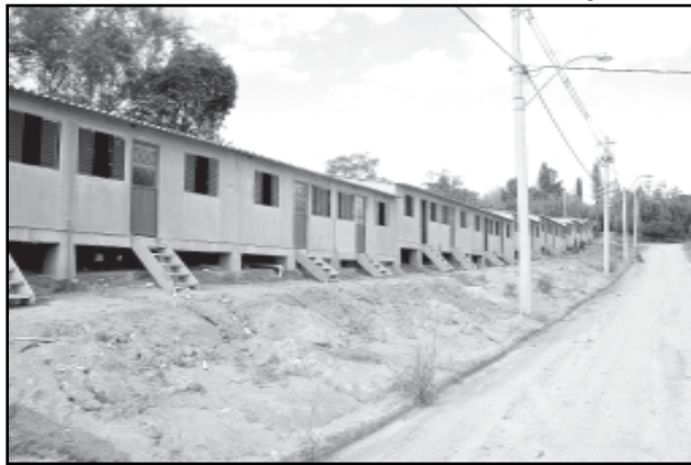
Habitação de interesse social já beneficiou 1.737 famílias com novas moradias