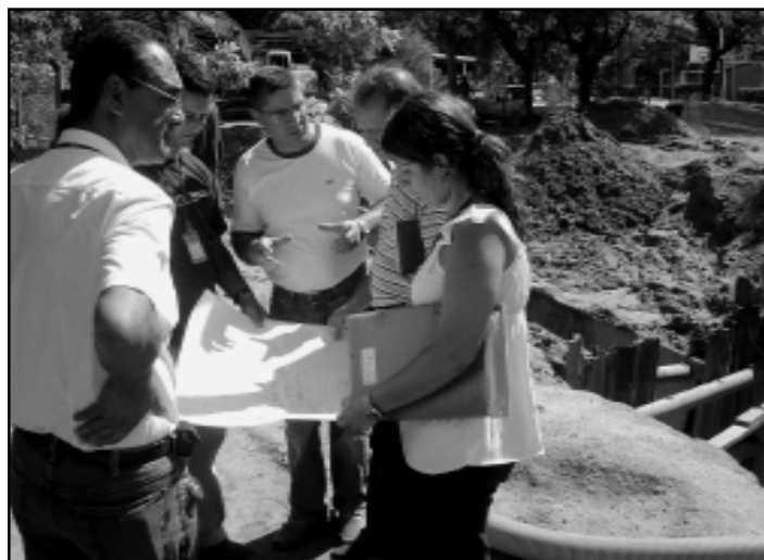
Entre as ações, a obra de um novo ponto de captação com investimento de R$ 1,628 milhão

A canalização, que deverá estar pronta em março de 2006, tem 710m, dos quais 540m são subaquáticos. A iniciativa visa à captação em um dos pontos de maior correnteza do rio, onde a água é mais rica em biodiversidade.