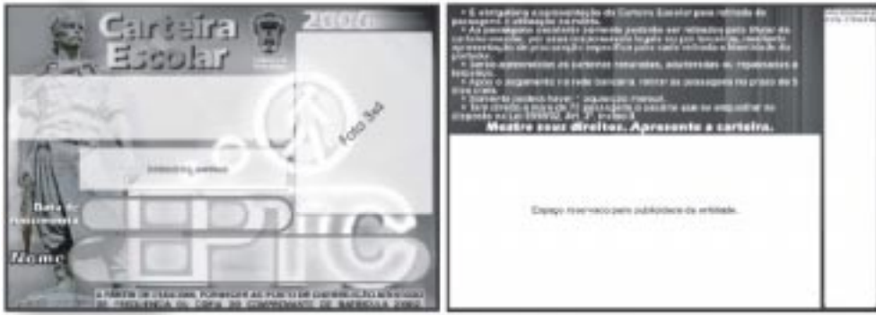
Estudantes ensino fundamental, médio, eja, técnico profissionalizante, cursos preparatórios e ensino superior- cor azul – Pantone 300U-9,5 cm X 6,7 cm