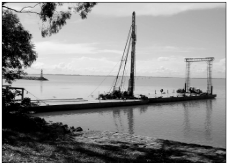
O novo ponto vai captar onde a água é mais rica em biodiversidade

Não há neste momento floração próximo aos outros cinco pontos de captação de água bruta no Lago Guaíba (São João/Moinhos de Vento, Menino Deus, Belém Novo, Lami e Ilha da Pintada), que juntos representam cerca de 94% da água tratada que abastece a população de Porto Alegre.