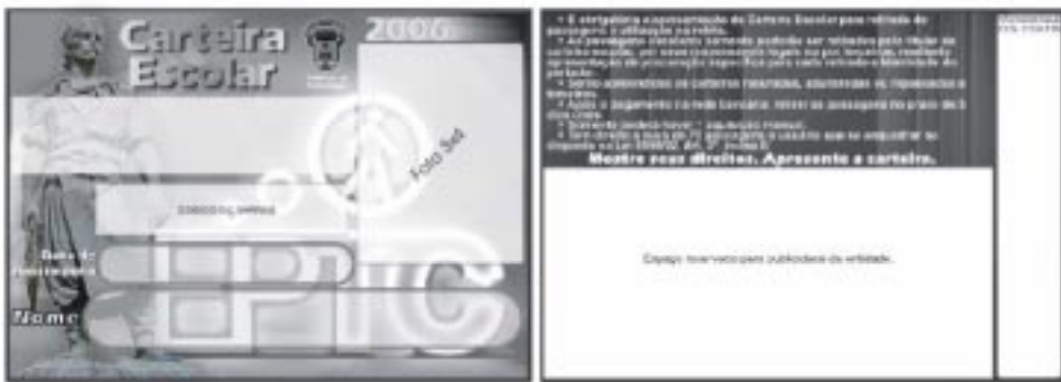
Professores – cor azul – Pantone 300U - 9,5 x 6,7 cm