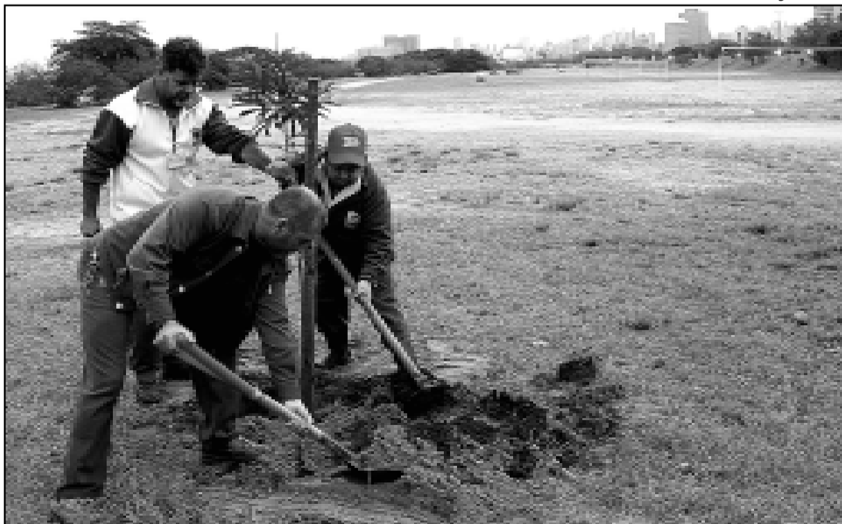
Primeira etapa abrange a área situada entre a Usina do Gasômetro e o Parque Gigante

O objetivo é recompor a vegetação local, qualificando os espaços, caracterizando áreas de descanso e contemplação, além de proporcionar abrigos ecológicos para a avifauna. A orla do Guaíba constitui-se por lei federal e pela Lei Orgânica do Município Área de Preservação Permanente e patrimônio de Porto Alegre. “A secretaria está priorizando a recomposição da vegetação nessa área, tanto que inserimos esse programa no Plano Plurianual”, afirmou o secretário municipal do Meio Ambiente.