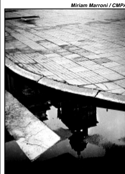
Reflexo na água por Miriam

Fotos em preto e branco de Porto Alegre estão reunidas na exposição do X Concurso Anual Sioma Breitman de Fotografia, montada no Salão Adel Carvalho da Câmara Municipal até 4 de outubro. São 21 trabalhos feitos em