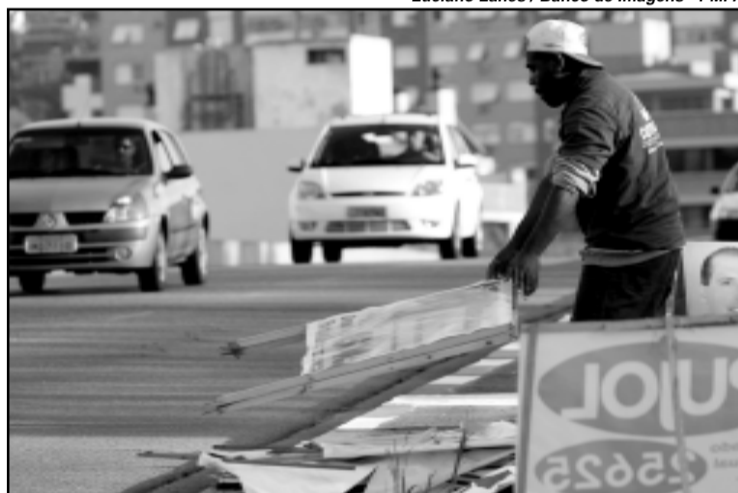
Operação envolveu 746 funcionários, 34 caminhões e 11 veículos de apoio

A estimativa do DMLU é de que o lixo eleitoral deste ano duplicou, se comparado com a eleição municipal de 2004. O galpão de 180 metros quadrados alugado pelo Tribunal Regional Eleitoral (TRE) ainda está lotado de material de campanha. “Só estamos esperando o