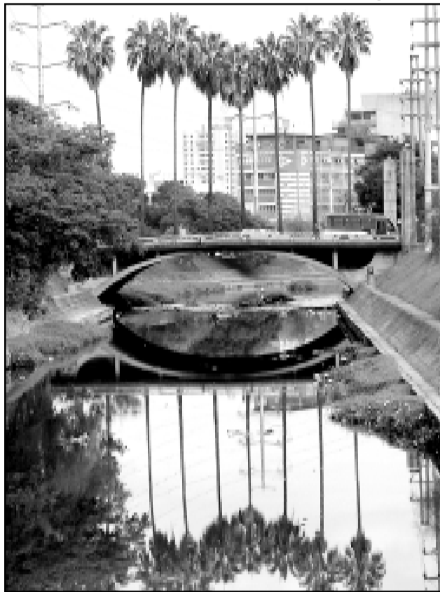
Programa vai aumentar a capacidade de tratamento de esgotos na Capital

Segundo o diretor-presidente do Dmae, a partir do ano que vem será antecipada a contrapartida da Prefeitura, lançando a rede de esgoto das bacias do Bairro Cavalhada e da Restinga. O Socioambiental está orçado em 160 milhões de dólares, sendo 60% com recursos do BID e os 40% restantes com investimentos do Ministério das Cidades e do Dmae. A Prefeitura estima que, em dez anos, o programa esteja concluído, aumentando a capacidade de tratamento de esgotos da