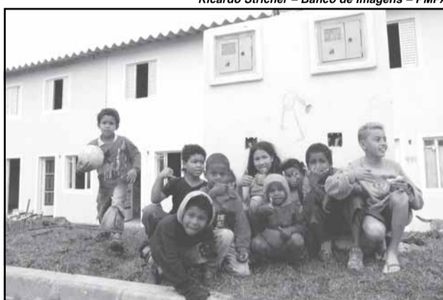
Ricardo Stricher – Banco de Imagens – PMPA