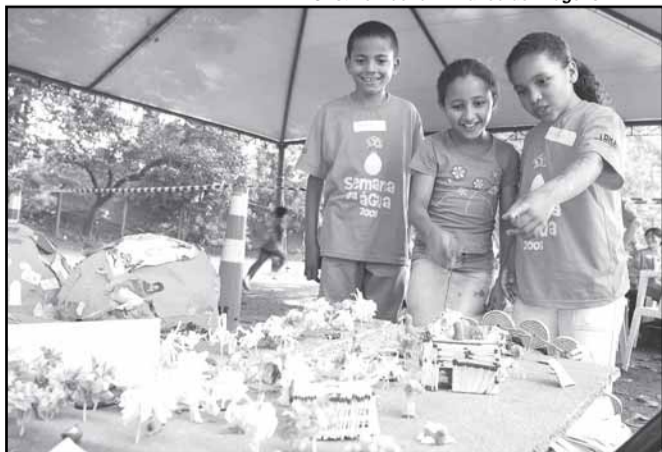
Alunos aprenderam a manter os cuidados com a água e o hábito da separação do lixo

Na programação, atividades recreativas, como o Jogo da Água, o Mapa da