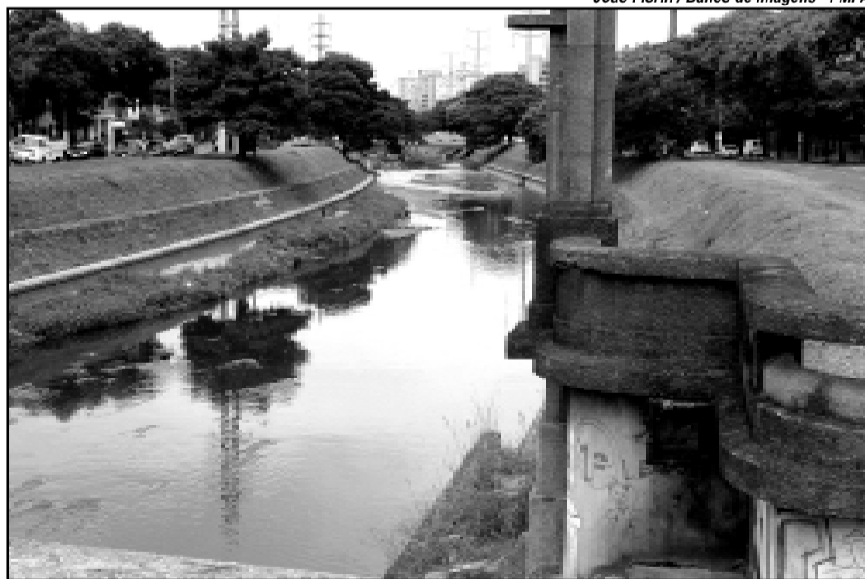
Trabalho deve iniciar em junho

A contrapartida do município é a promoção de licitação, ainda no mês de abril, para contratação de operadores e locação de caminhões que farão o transporte da areia retirada do Dilúvio. Uma das dragas que entrará em operação