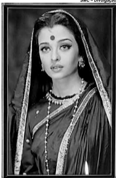
Aishwarya Rai, ex-Miss Universo, está no elenco de Devdas (2002)

média e são repletas de números musicais. Entre as atrações da mostra Bollywood Super Hits, o destaque é Devdas (2002), tido como o mais caro filme já feito em Bollywood. Estrelado pela atriz Aishwarya Rai, a ex-Miss Universo que tornou-se a “Rainha de Bollywood” (Rai atualmente está filmando no Rio de Janeiro), Devdas tornou-se um filme cultuado em cidades como Paris e Londres, depois de causar furor no Festival de Cannes em 2003.