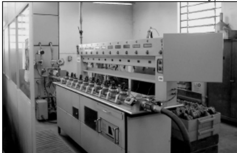
Dmae possui bancada eletrônica para aferir funcionamento de hidrômetros