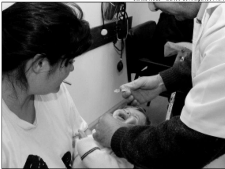
O CS Bom Jesus atende uma média mensal de 13 mil pessoas, sendo 9 mil no PA e 4 mil no ambulatório básico

A reorganização de espaços, melhoria no atendimento e uma nova relação com a comunidade foram as metas alcançadas no primeiro semestre deste ano no Centro de Saúde Bom Jesus (CSBJ, na Rua Bom Jesus, 410). Com o pronto atendimento (PA) 24 horas, o CS Bom Jesus está atendendo