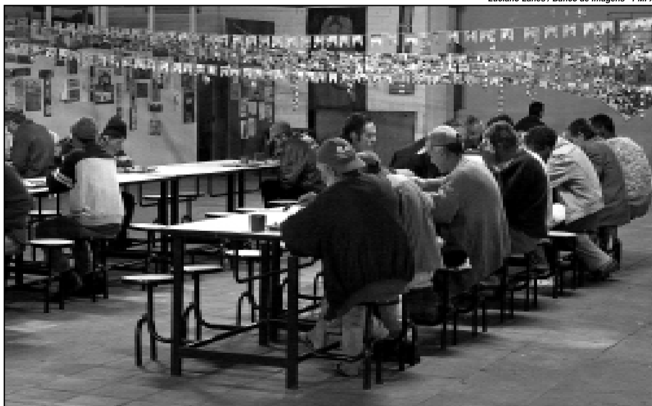
Usuários têm acesso a banho quente, troca de roupa, jantar e café da manhã