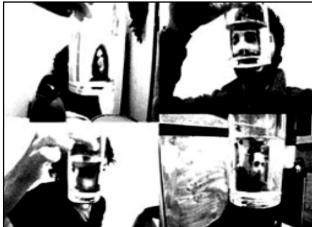
Exposição é formada por registros fotográficos, intervenções e instalações sonoras