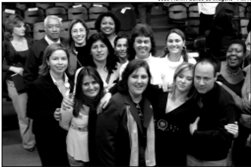
Curso teve 37 alunos divididos em duas turmas

“A Prefeitura está beneficiando a cidade de Porto Alegre, onde surdos terão mais acesso aos serviços públicos ao encontrarem pessoas que se comunicam nessa linguagem, garantindo seu direito de igualdade”, considerou o prefeito, lembrando que a qualificação dos funcionários para o atendimento aos surdos está de acordo com a lei municipal nº 7.857, de 30 de setembro de 1996, que instituiu a Língua de Sinais no Município de Porto Alegre. O prefeito também anunciou a ampliação do curso para o segundo semestre, quando serão formadas três turmas de 35 alunos.