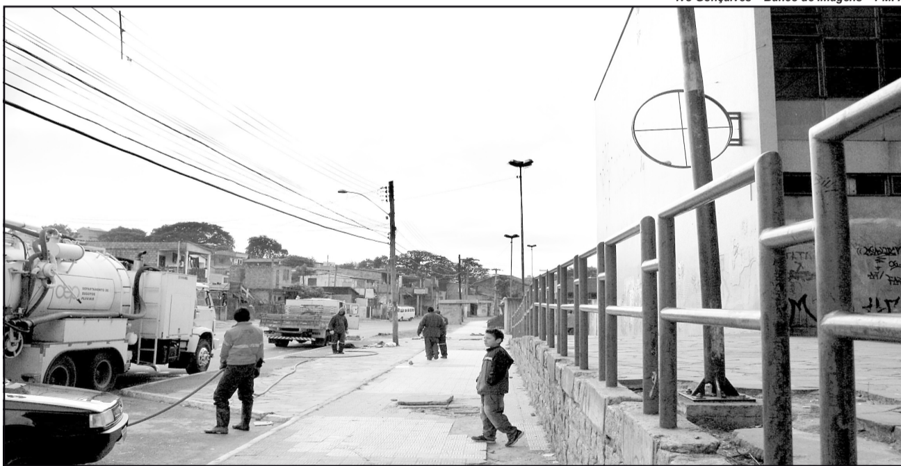
Técnicos e engenheiros da prefeitura vistoriaram as obras emergenciais que estão sendo realizadas no Pronto-Atendimento

Além do aumento da varrição, que já passou a ser diária no local, o Departamento Municipal de Limpeza Urbana (DMLU) determinou que seja realizada a pintura de meio-fios. Em relação à iluminação externa do prédio, a Smov fará a revisão e, em médio prazo, existe a possibilidade de a Companhia Estadual de Energia Elétrica (Ceee) executar um novo sistema de iluminação por meio do projeto social Pró-Luz.