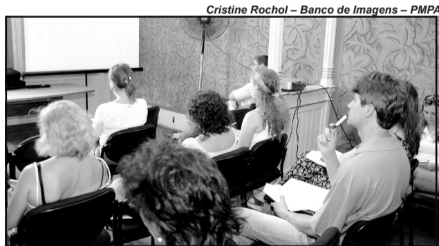
As palestras acontecem na Casa Torelly - Av. Independência 453