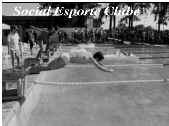
Parceria entre prefeitura e entidades promove inclusão social pelo esporte

Um projeto dedicado a inclusão pelo esporte entra em campo, hoje, às 14h30min, quando o Prefeito Municipal e dirigentes dos principais clubes sociais de Porto Alegre assinam no Paço Municipal, na Praça Montevideu, 10, o termo de par-