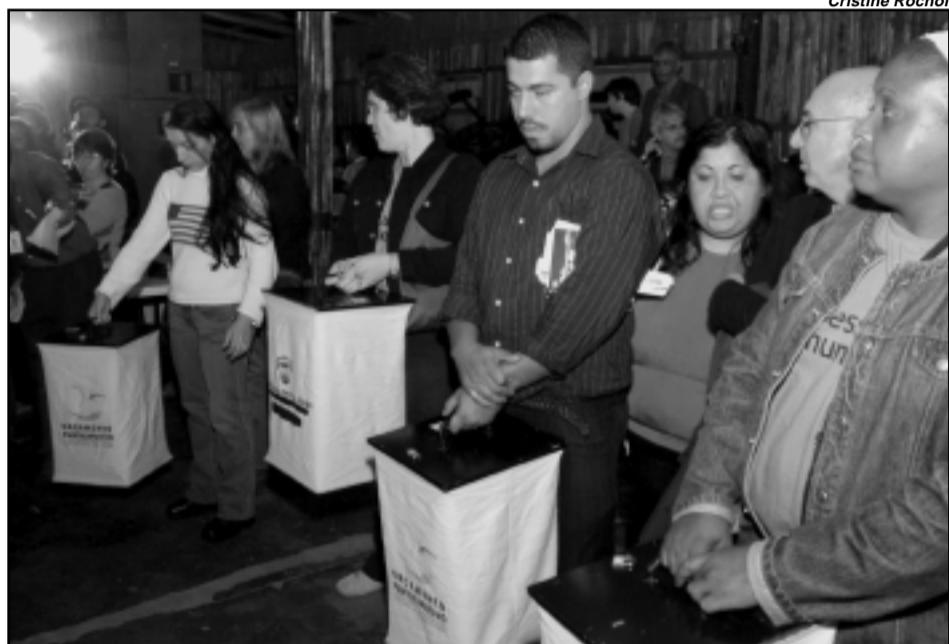
Os participantes elegeram habitação, educação, pavimentação e assistência social como prioridades