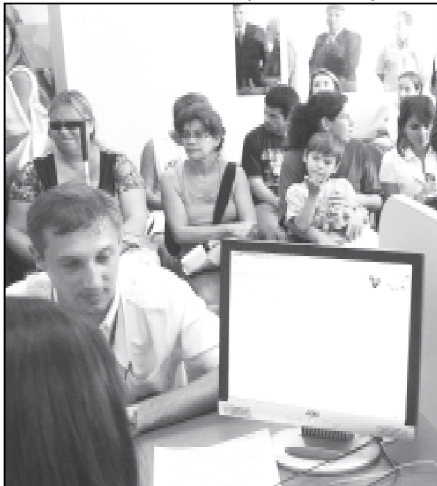
A previsão é de atender de 100 a 120 pessoas diariamente