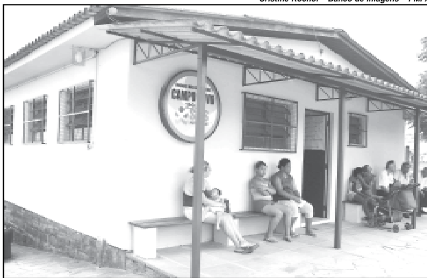
Trinta unidades foram reformadas até o final de fevereiro

O ato dá continuidade ao trabalho que começou em outubro do ano passado, quando foi organizado um mutirão formado por funcionários da Secretaria Municipal de Saúde para realizar as reformas. Trinta unidades foram reformadas até o final de fevereiro. Segundo a Secretaria da Saúde o projeto inclui a melhoria de serviços que qualifiquem o atendimento à comunidade. A