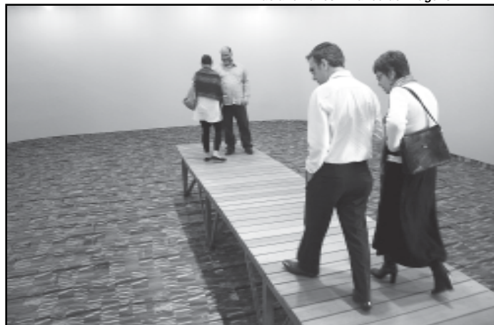
A mostra de arte contemporânea vai até o dia 18 de novembro