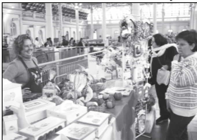
Participam 55 artesãos da Smic, Incubadora da Mulher e Clubes de Mães

Nas palestras, também são abordadas questões relacionadas ao lixo, a importância de separar, reduzir e reutilizar, a destinação correta do esgoto cloacal (doméstico) para estações de tratamento de esgoto e os aterros sanitários.