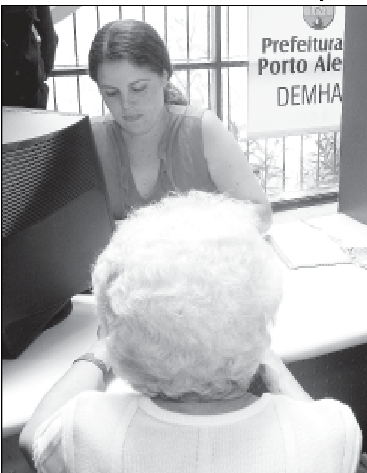
As inscrições devem ser feitas na sede do Demhab de segunda a sexta-feira, das 9h às 11h30 e das 14h às 17h30

É um plano 100% financiado pela Caixa Econômica Federal em que você paga durante 15 anos taxas mensais de