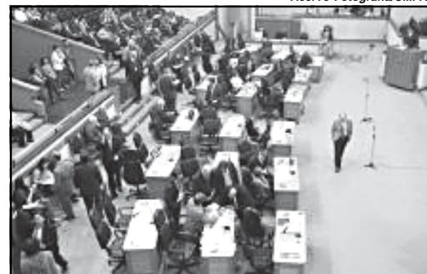
Câmara em Ação