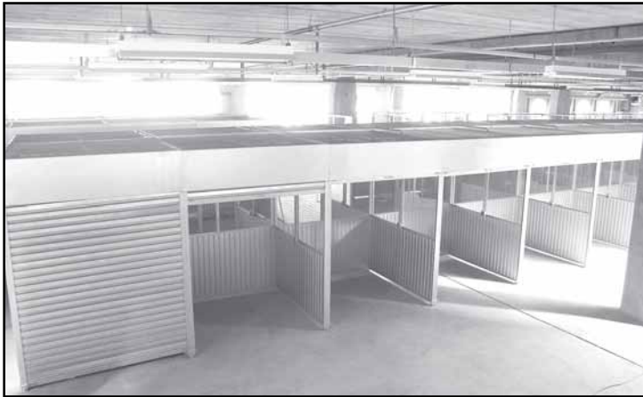
Bancas serão independentes e terão em média quatro metros quadrados