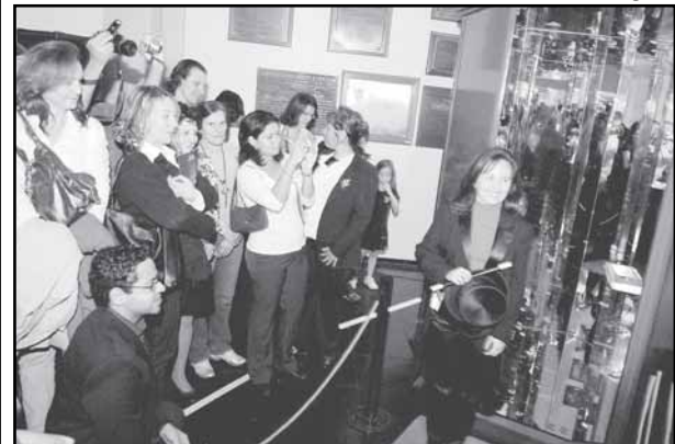
A artista (d) e o trabalho vencedor

Textos elaborados e de responsabilidade da Assessoria de Comunicação da Câmara