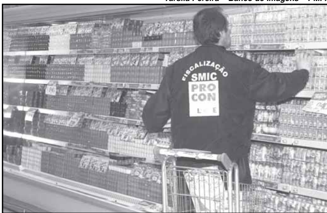
Os fiscais do Procon estiveram presentes em cerca de 1.200 estabelecimentos comerciais

(2.620), por e-mail. Inaugurado há apenas um mês, o serviço de atendimento eletrônico, acessado através da página do Procon na Internet, http://www.portoalegre.gov.br/procon , registrou 431 consultas encaminhadas para mediação. Oitenta e quatro por cento dos casos que chegam ao Procon são resolvidos durante a primeira visita, ou, no máximo, cinco dias após apresentada a reclamação.