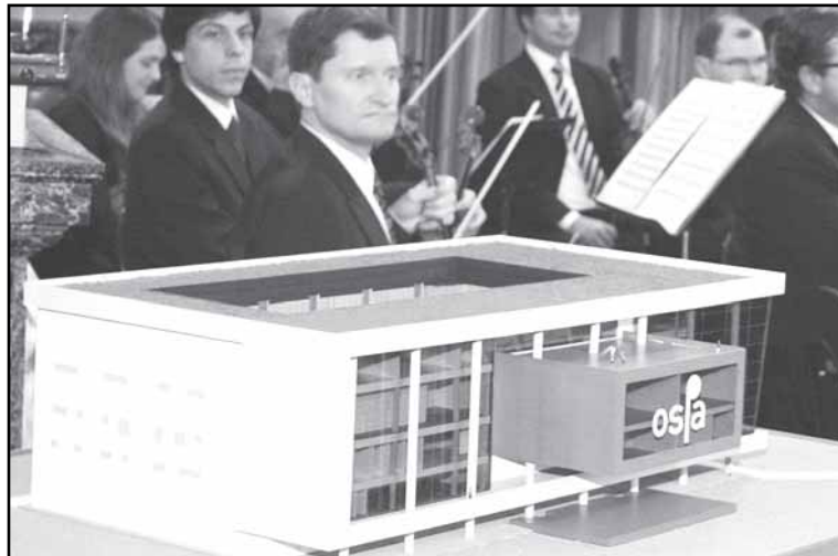
Maquete do Teatro da Ospa foi apresentada em julho, no Palácio Piratini

O projeto prioriza a integração do teatro com o Guaíba e o Parque Maurício Sirotsky Sobrinho (Harmonia), com espa-