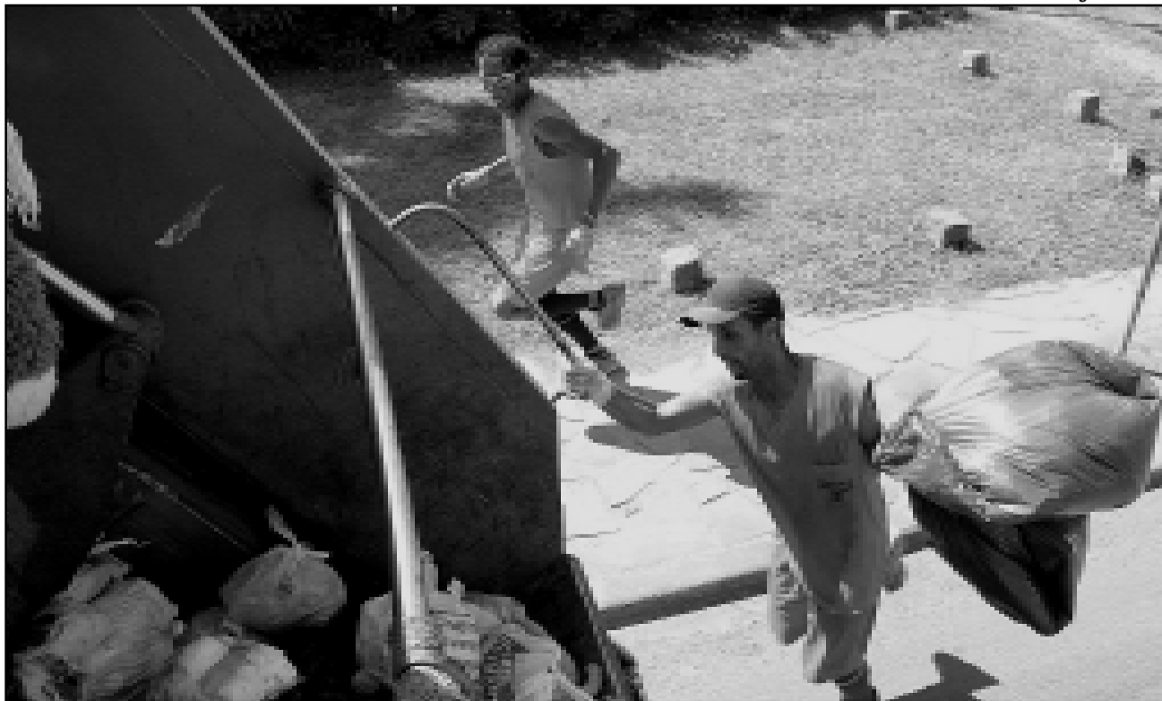
Coleta: roteiros serão ampliados