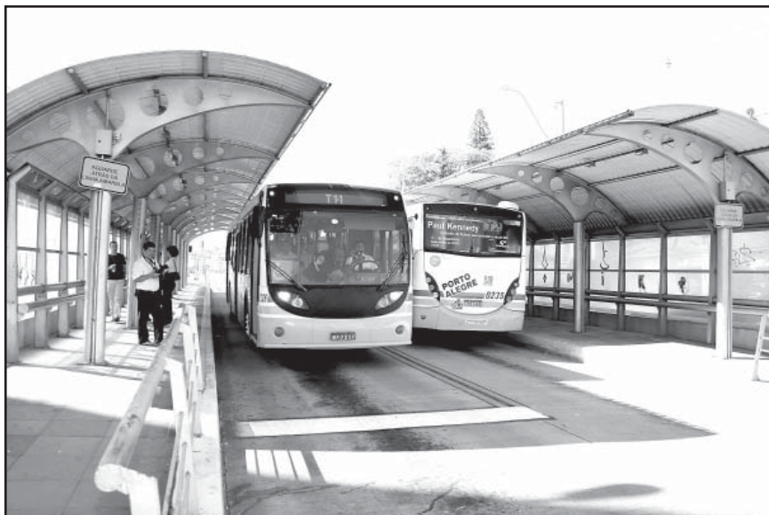
O sistema abrange linhas circulares, urbanas e metropolitanas e trem metropolitano integrado ao projeto Portais da Cidade.

Durante o encontro, foi apresentado um estudo estratégico do transporte público envolvendo a Capital e mais 12 municípios da Região Metropolitana, elaborado em parceria por técnicos da Prefeitura, pela Empresa Pública de Transporte e Circulação (EPTC), Metroplan e Trensurb. “Qualquer solução que vier a ser implantada será por um arranjo metropolitano, com apoio do governo federal”, disse o secretário do Ministério das Cidades. Também participaram da reunião os secretários municipais de Gestão e Acompanhamento Estratégico