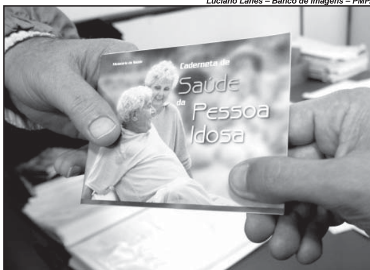
A caderneta serve como documento de registro do estado de saúde do idoso.

A caderneta será um instrumento de coleta e registro de dados, ficará em poder do próprio usuário e facilitará a identificação dos idosos com maior fragilidade e risco de complicações graves decorrentes de problemas de saúde. Nesta primeira etapa, serão distribuídas cadernetas na área de abrangência dos Programas de Saúde da Família (PSF) da Gerência Distrital Restinga-Extremo Sul. O registro começará com cerca de 1,6 mil idosos dos PSFs Pitinga, Ponta Grossa, Chácara do Banco e Castelo.