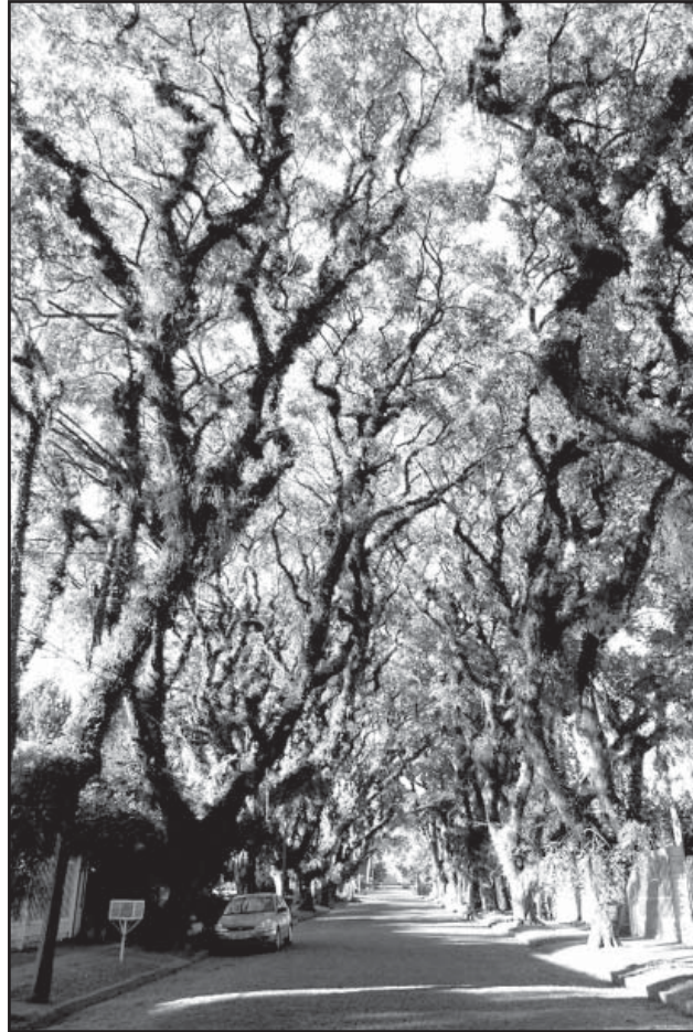
Árvores da rua João Mendes Ouriques serão protegidas