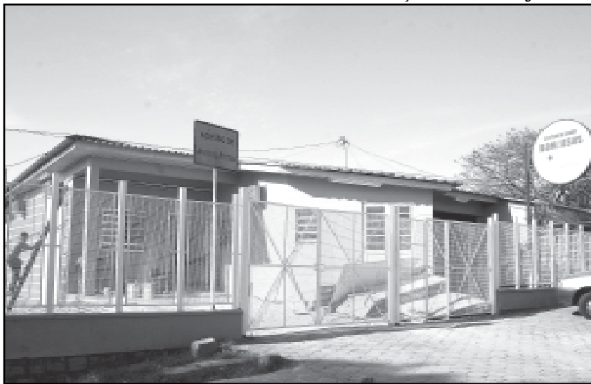
Prefeitura investiu R$ 1 milhão na reforma do Centro de Saúde