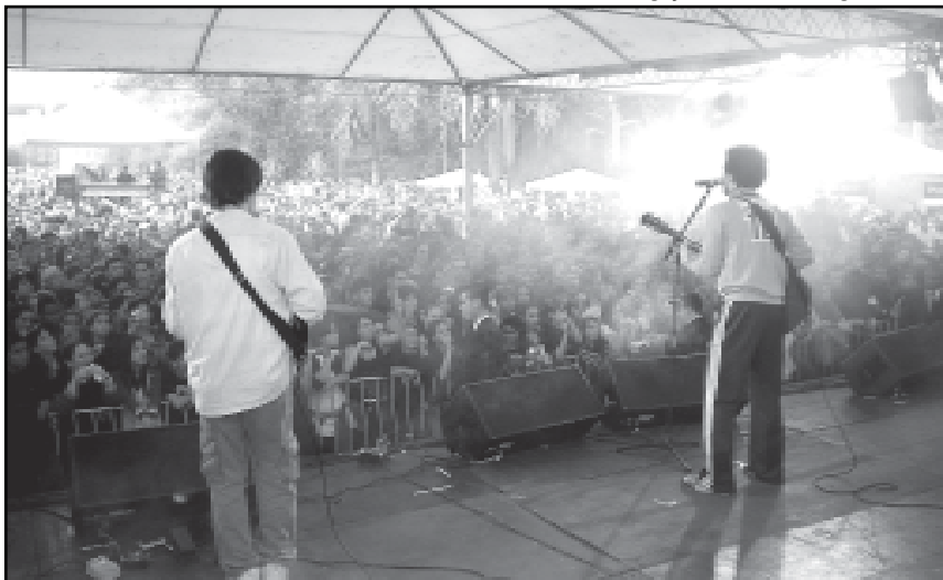
A última edição da Tenda, em 19 de agosto, levou mais de 40 mil jovens ao Parque Farroupilha