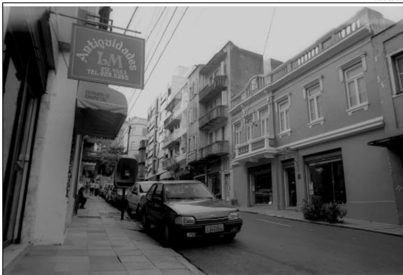
Lojas do Caminho dos Antiquários poderão ser freqüentadas durante o horário da feira