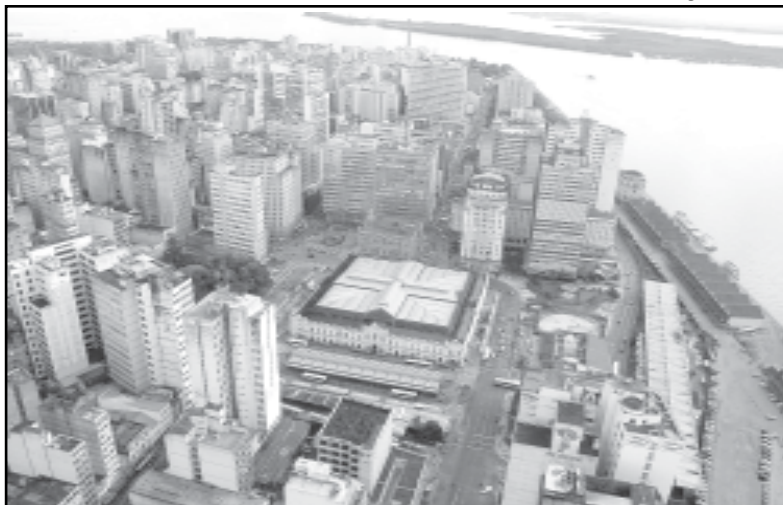
O estudo das alturas ficou restrito à chamada Macrozona 1, que abrange a área central da cidade, Terceira Perimetral até a orla do Guaíba