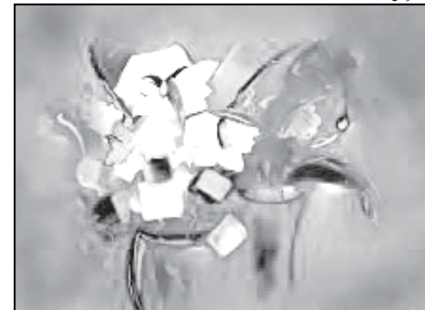
Trabalhos exibem cores gigantes

Textos elaborados e de responsabilidade da Assessoria de Comunicação da Câmara.