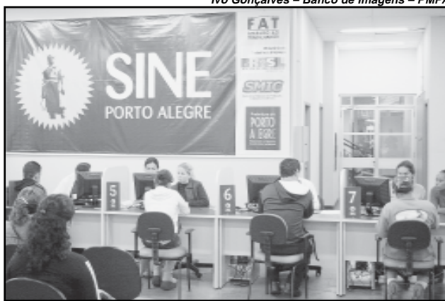
A municipalização do Sine foi aprovada em junho de 2006 pela Comissão Municipal de Emprego

A municipalização do Sine foi aprovada em junho de 2006 pela Comissão Municipal de Emprego (CME). As empresas interessadas no aproveitamento de mão de obra do Sine podem solicitar uma visita dos captadores de vagas pelo telefone 32894796 ou pelo e-mail sine@smic.prefpoa.com.br. O serviço é gerenciado pela prefeitura, por meio da Secretaria Municipal da Produção, Indústria e Comércio (Smic).