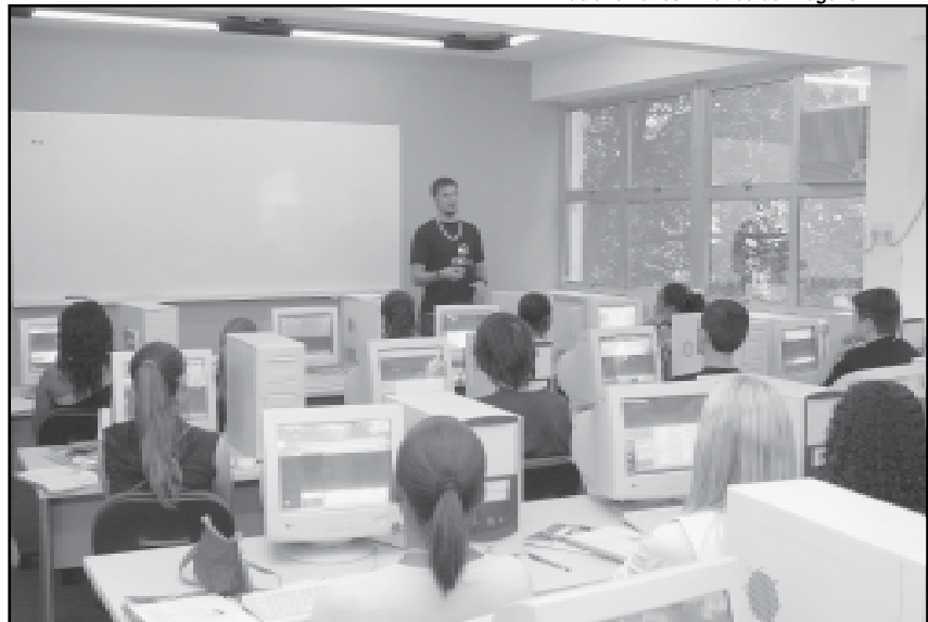
Na segunda edição do projeto de qualificação profissional serão oferecidas dez modalidades de cursos gratuitos

Inscrições e cursos oferecidos – Haverá dois períodos de inscrição: entre 13 e 16 de agosto e entre 1º e 11 de outubro. Os inscritos serão selecionados por sorteio público eletrônico.