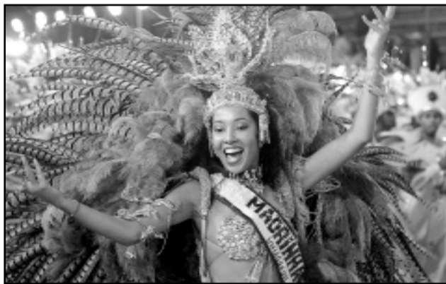
Transmissão via Internet é inédita no carnaval de Porto Alegre