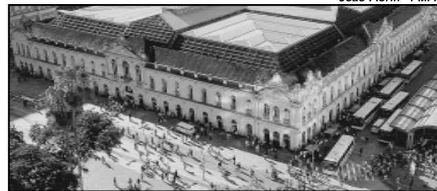
Trabalho será coordenado pela SPM, por meio do Programa Viva o Centro