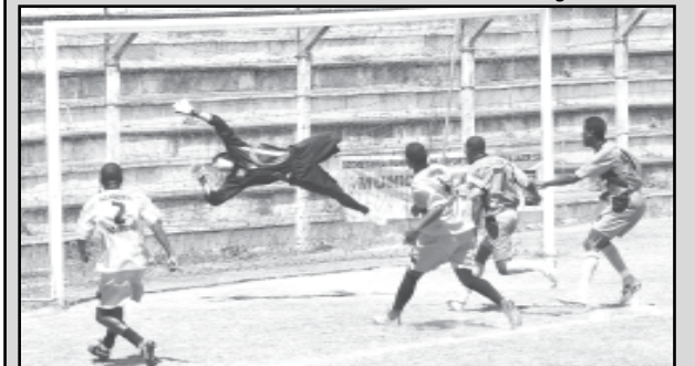
Os jogos começam neste mês