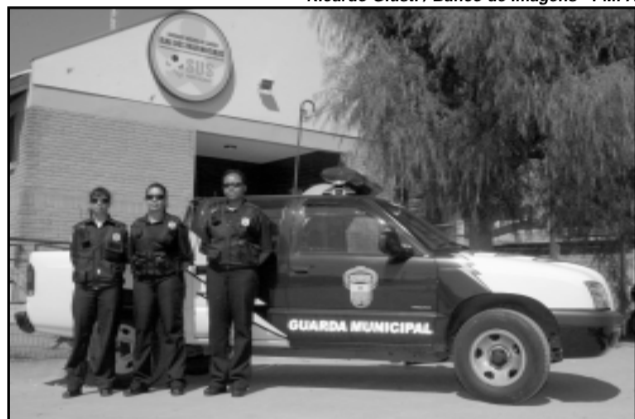
Corporação foi criada em 1892