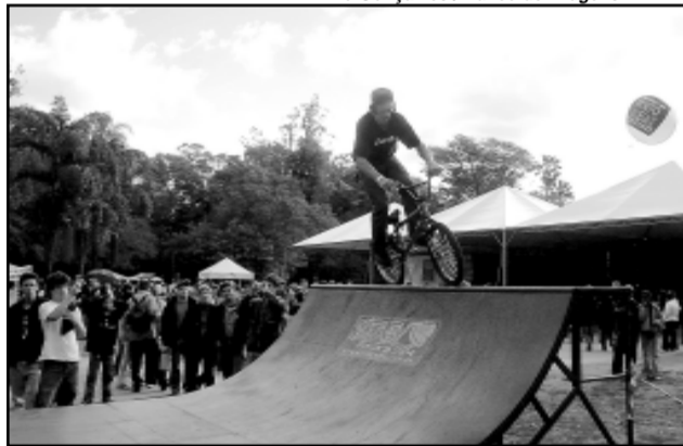
5ª Edição da Tenda da Juventude será no dia 03 de dezembro