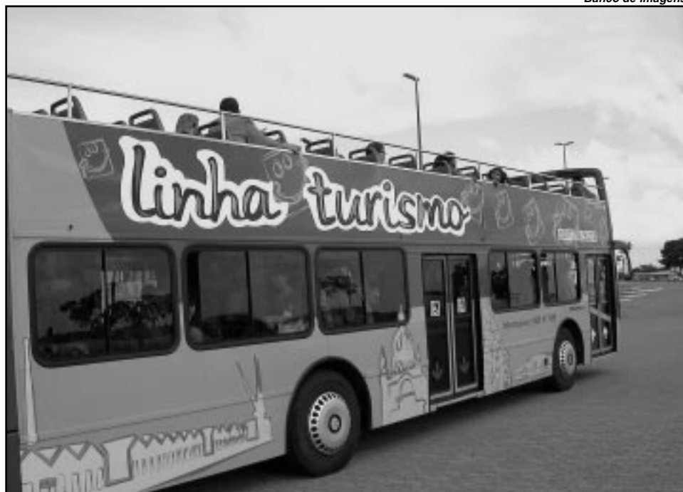
Ônibus de dois andares percorre os principais pontos turísticos da cidade

Para aproveitar a Linha Turismo durante o feriado basta adquirir o ingresso na Central de Atendimento junto ao Porto Alegre Turismo - Escritório Municipal (Travessa do Carmo, 84), onde fica o terminal de partida e chegada do ônibus. Serão realizadas cinco saídas diárias nos horários das 9h, 10h30min, 13h30min, 15h e 16h30min. Informações pelos fones 3212-0721 ou 0800-51 7686.