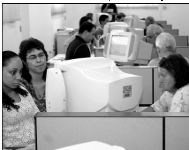
A Loja de Atendimento da SMA funciona das 9h30 às 16h30 na Travessa Mário Cinco Paus, s/nº