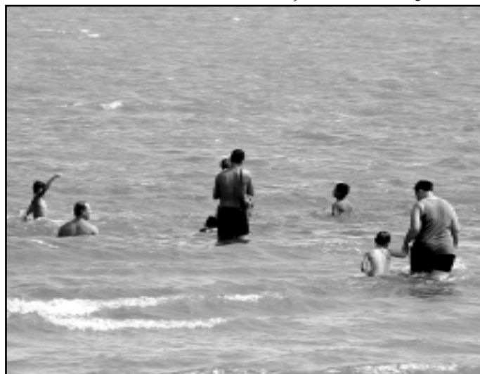
Passeio à praia do Lami integra a programação da Colônia de Férias