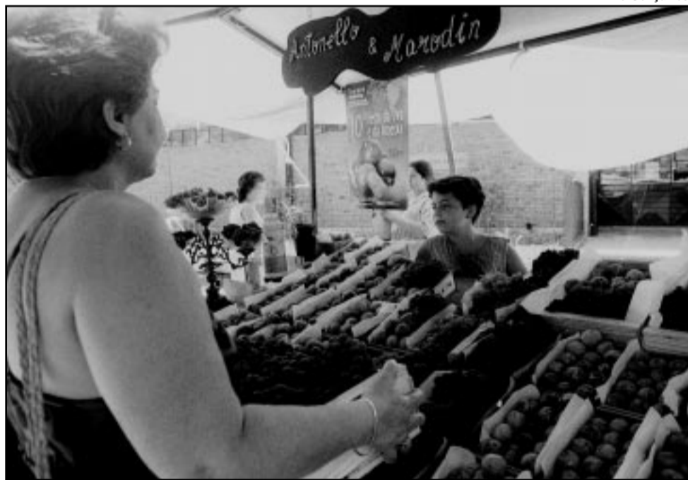
Expectativa é de que sejam consumidas 37 toneladas de frutas