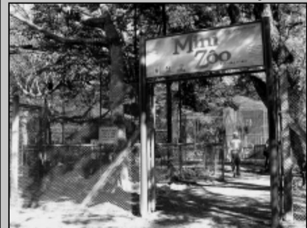
O minizoológico do Parque Farroupilha está no roteiro da colônia de férias