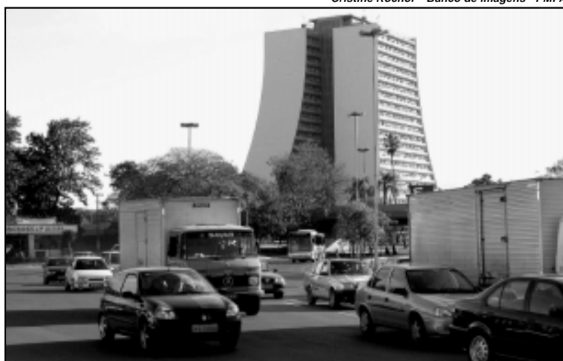
Cristine Rochol – Banco de Imagens – PMPA

destacada, embora os números da violência no trânsito ainda sejam alarmantes.