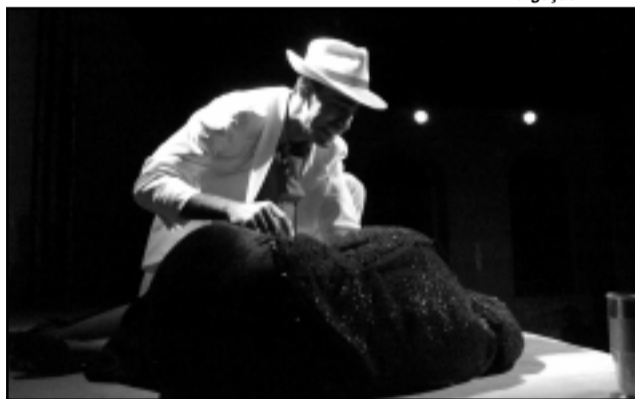
Teatro: Hamlet Sincretico estará em cartaz às quartas e quintas no Hospital Psiquiátrico São Pedro

caram durante o ano, valorizando desta forma os prêmios e a produção da classe artística porto-alegrense. Além dos espetáculos que estarão no Teatro Renascença, estão sendo divulgadas as temporadas dos espetáculos indicados que acontecerão em outros teatros, de janeiro a março.