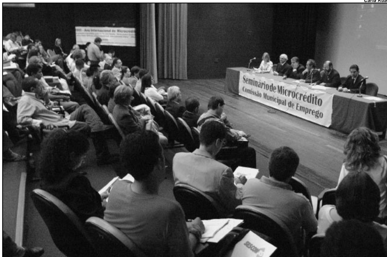
Seminário divulgou linhas de financiamento disponíveis para quem atua no município