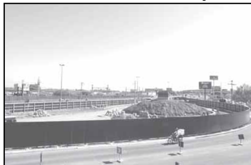
Monumento terá total visibilidade e integração com o entorno

A praça foi demarcada e também estão concluídos o pedestal e a Coxilha do Laçador, onde a estátua ficará a 3,5 metros acima do nível do solo, permitindo melhor visualização. O Sítio do Laçador terá seis espaços diferenciados, onde estão presentes as cores da bandeira do Rio Grande do Sul - verde, amarelo e vermelho. O monumento terá total visibilidade e integração com o entorno. Já a Plataforma Cívica, com três mastros para bandeiras, é um espaço com cerca de 70 metros quadrados.