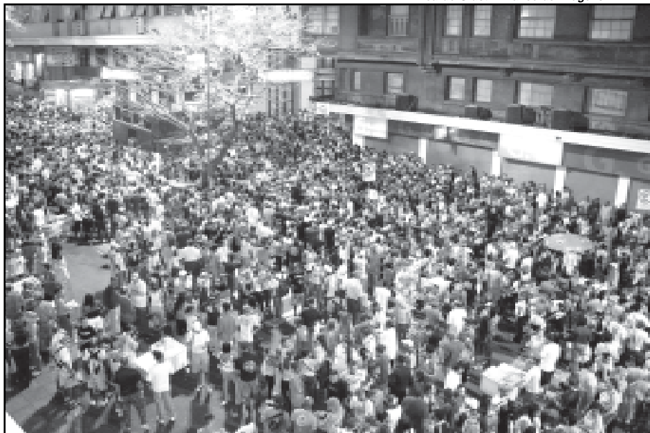
Os desfiles dos Antigos Carnavais da Borges começam dia 30