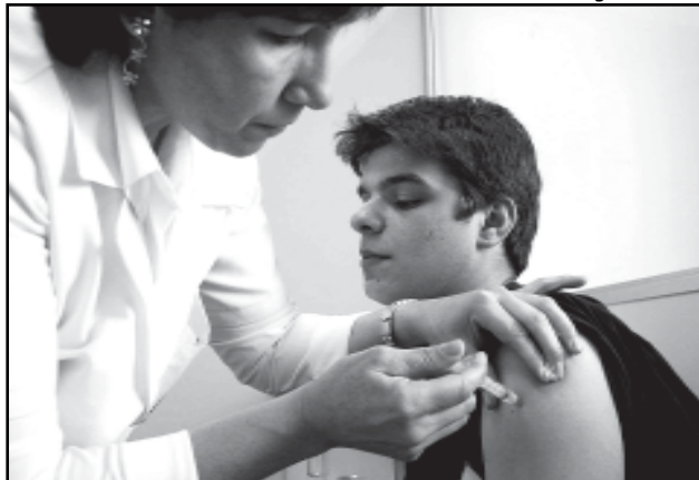
A epidemia está concentrada em homens na faixa etária dos 20 aos 34 anos