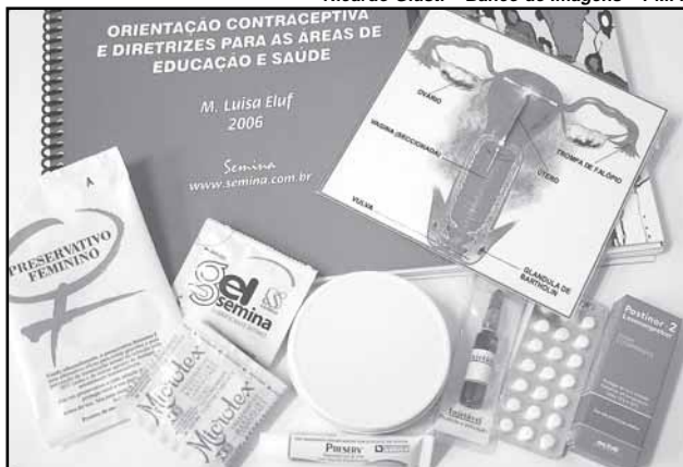
Secretaria distribuiu kits didáticos de Planejamento Familiar

Longe da escola — Na Capital, mais de 25% das mulheres em idade fértil são adolescentes. Segundo Soraia Schmidt, que estudou os riscos da gravidez na adolescência, as gestações nessa faixa etária (entre 10 e 19 anos) concentram as maiores taxas de mortalidade infantil, baixo peso ao nascer e prematuridade.