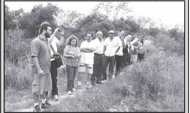
Os cursos têm o objetivo pedagógico de qualificar as visitas orientadas