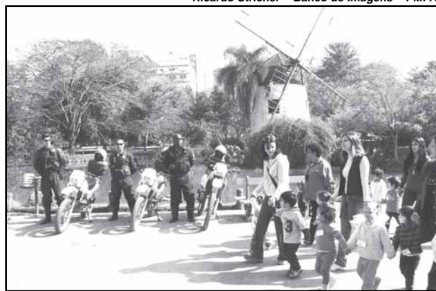
Agentes de segurança têm atuado em parques e praças da cidade