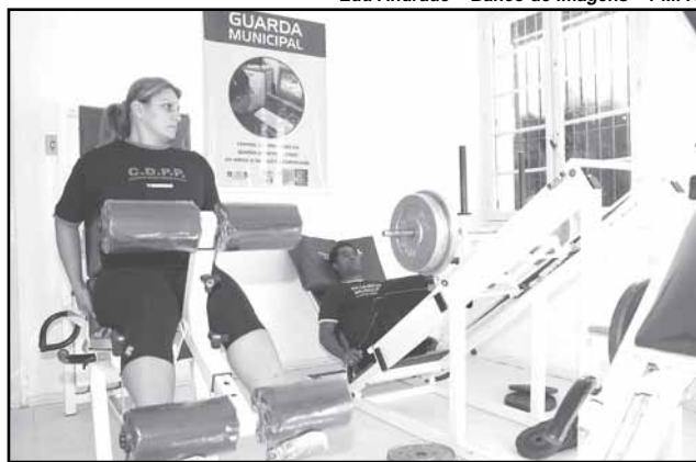
Centro de Formação e Treinamento funciona desde 2006

disponibiliza mais de 1,8 mil vagas nos cursos oferecidos. São cursos de segurança na escola, atualização, gestão, defesa pessoal e segurança urbana em parques e praças, mediação de conflitos, prevenção no combate às drogas, justiça restaurativa, atendimento ao público, táticas de intervenção, informática básica, direção defensiva, controle do tumulto, treinamentos táticos com o Centro Avançado de Técnicas de Imobilização (Cati) e Special Weapons and Tactics (Swat), entre outros.