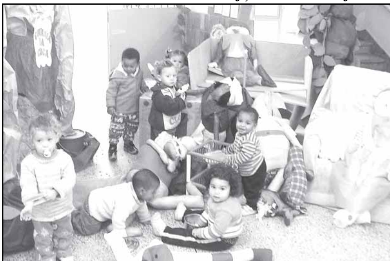
Escola atende crianças de zero a cinco anos e 11 meses