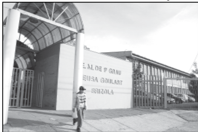
Escola de Ensino Fundamental Neuza Goulart Brizola faz aniversário este mês