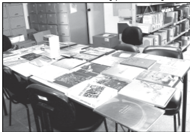
Biblioteca fica na Rua dos Andradas, 680, 4º andar

Acesso - O acervo da biblioteca também é composto por CDs, vídeos e DVDs. Interessados podem acessar o acervo para consulta local, de terça a sexta-feira, das 9h às 17h30. O empréstimo do acervo é restrito a funcionários, professores e