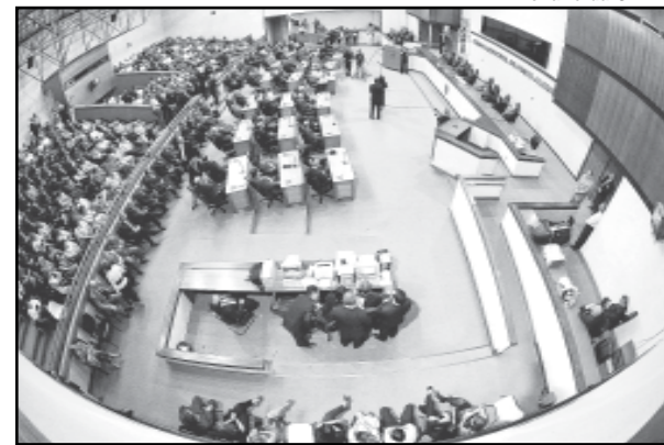
Plenário da CMPA