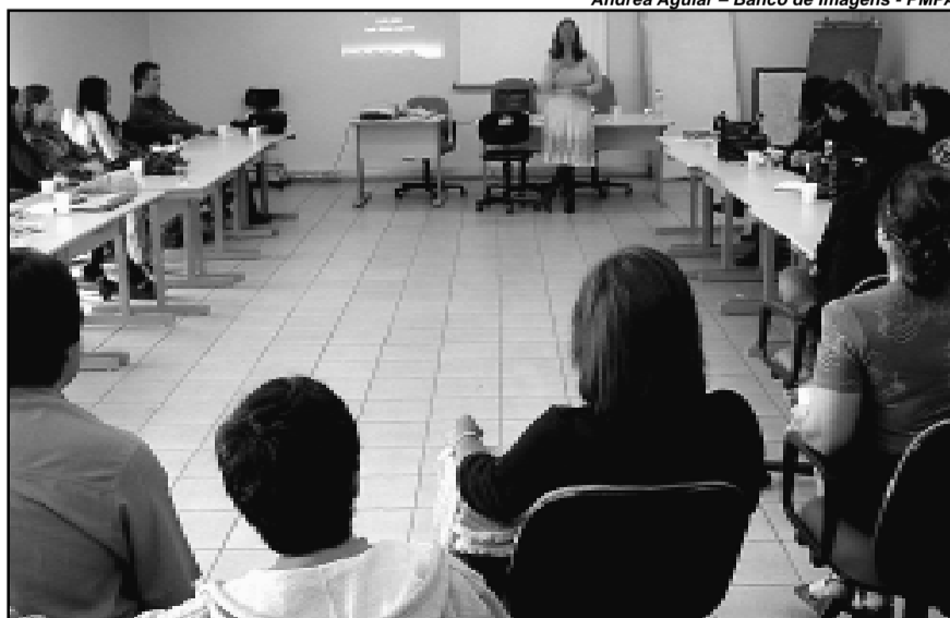
Evento faz parte da agenda de capacitação promovida pelo abrigo