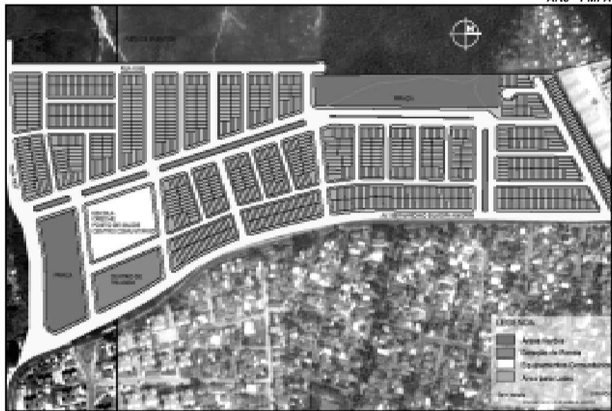
O projeto contempla casas, praça, galpões de reciclagem, creche, centro de saúde e espaço para comércio