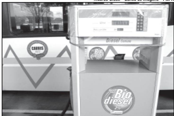
A Carris é a primeira empresa de transporte urbano do Estado a aderir ao biodiesel