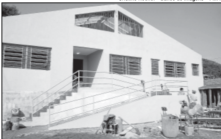
A ampliação da creche representa a possibilidade de atender as mães trabalhadoras da região

A instituição, conveniada desde 1996, foi umas das primeiras creches a firmar parceria com a pre-