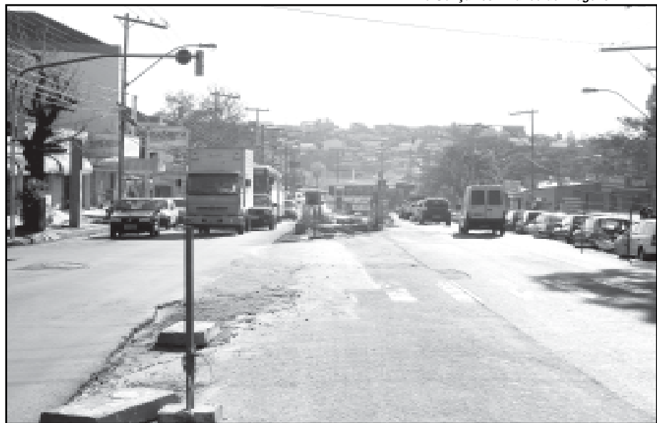
A previsão é de que as obras terminem em setembro de 2008

Linha Rápida — As obras de ampliação da Avenida Baltazar de Oliveira Garcia, na Zona Norte da Capital, fazem parte do programa Linha Rápida do governo estadual. São 5,5 km, num investimento de R$ 37 milhões para a construção de um corredor exclusivo de ônibus e duas pistas laterais. Trata-se de uma obra que beneficiará os 400 mil moradores da região, além de ser a principal ligação de Porto Alegre com Alvorada. Diariamente circulam 132 mil veículos pela avenida. Ao final das obras, previstas para setembro do ano que vem, a via poderá comportar até 230 mil viagens/dia.