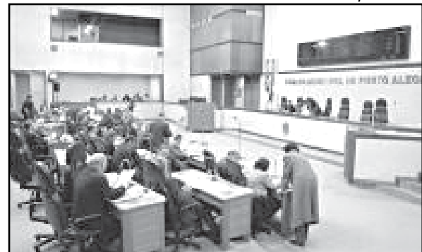
Plenário da Câmara

Textos elaborados e de responsabilidade da Assessoria de Comunicação da Câmara.