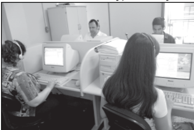
A Procempa já capacitou 14 pessoas com deficiência visual na unidade Usina do Gasômetro