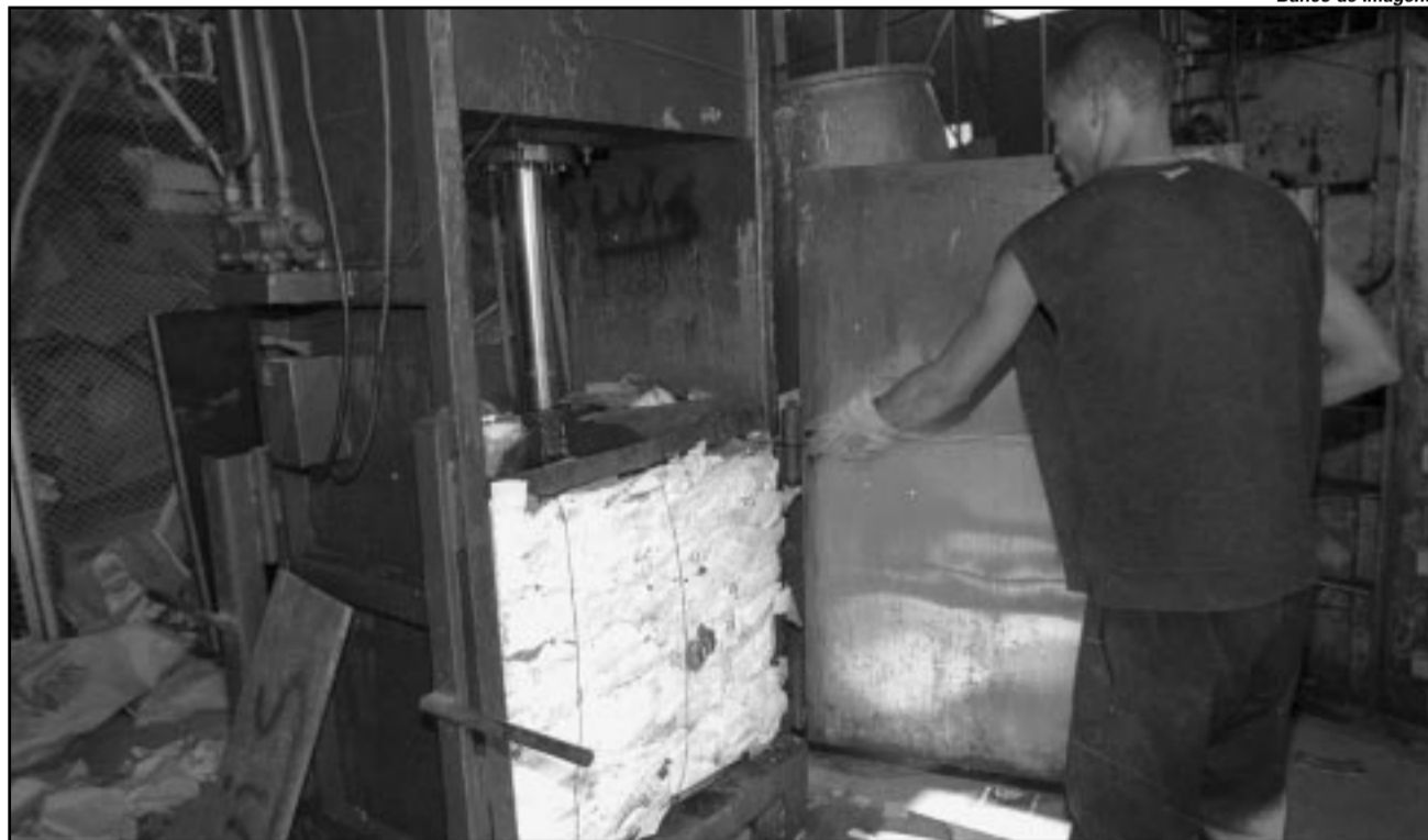
Trabalhadores terão mais autonomia com as novas instalações