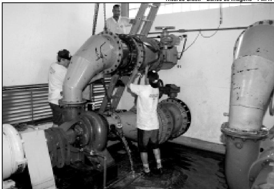
O trabalho faz parte do investimento de R$ 10 milhões que o Dmae realiza no Sistema Manoel Elias

O trabalho faz parte do investimento de R$ 10 milhões que o Dmae realiza no Sistema Manoel Elias com o objetivo de solucionar a intermitência no abastecimento nos bairros das zonas Norte e Leste atendidos pelo sistema. Essa intermitência ocorre principalmente quando o consumo de água aumenta, nos dias mais quentes.