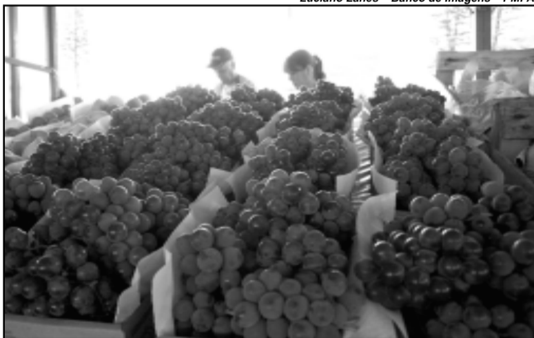
Nos primeiros dois dias, 20 mil pessoas visitaram a Festa e foram comercializadas 18 toneladas de frutas