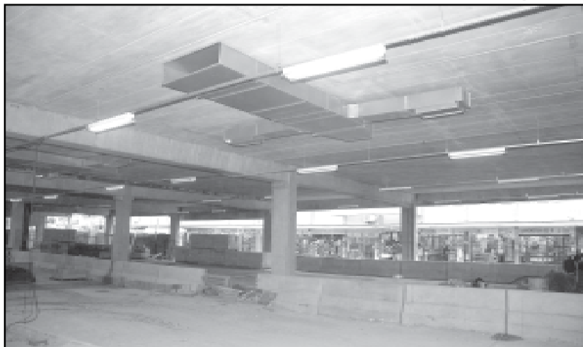
Camelódromo terá purificadores de ar no terminal térreo dos ônibus

Os filtros de renovação de ar e o cimento branco utilizado na construção do CPC foram exigidos no edital de li-