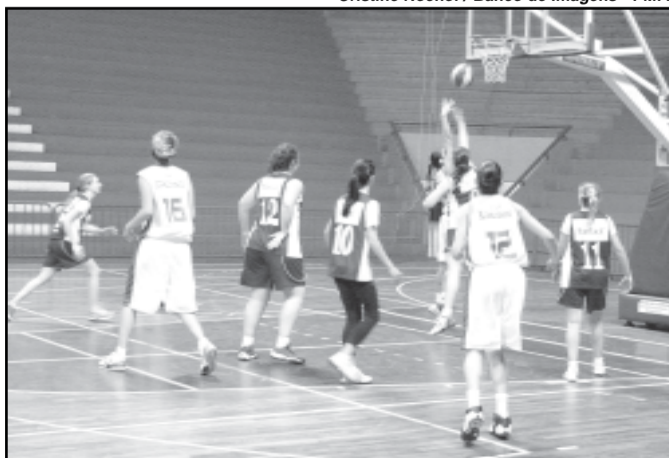
Sinodal e ABC fizeram a final da categoria feminina no municipal de basquete

Cestinhas da competição: Edinho (Confirmados) - 97 pontos - Série B Masculina; Mari (Sinodal) - 96 pontos - Feminina; Julio (Fronteira) - 144 pontos - Série A Masculina.