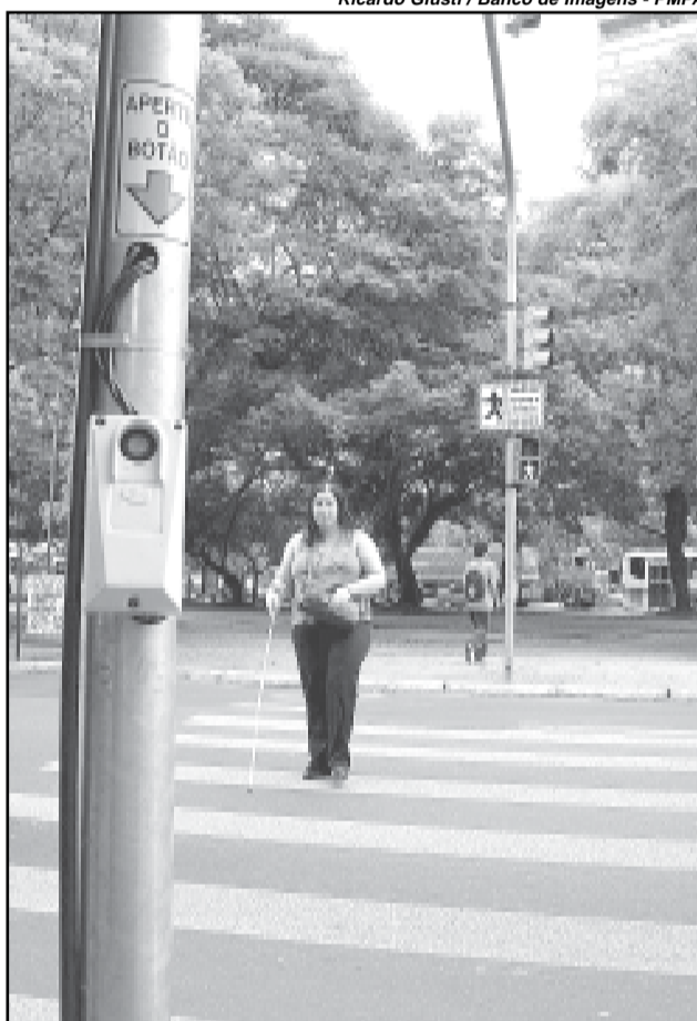
Ricardo Giusti / Banco de Imagens - PMPA

Realidade - Na escola Liberato, as aulas duram um ano e meio e têm organização curricular semestral. Neste mês, cerca de 50 alunos serão sorteados para formar uma turma de administração e outros 50 para contabilidade, pois ambos têm ingresso semestral. Já o curso de informática tem ingresso anual de alunos. “A gente se preocupa em