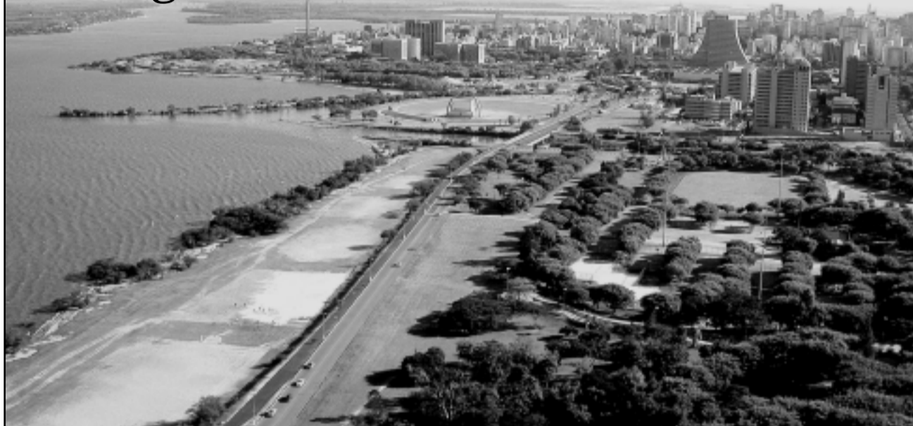
Porto Alegre será a quinta cidade brasileira a integrar rede de cooperação Internacional

O Prefeito de Porto Alegre participará do 8º Congresso Mundial de Metropolis , em Berlim, na Alemanha, de 11 a 15 de maio, no Hotel InterContinental. A missão desta Associação é favorecer a cooperação internacional e os intercâmbios entre os seus membros: governos locais e metropolitanos. O secretário de Captação de Recursos, Investimentos e Relações Internacionais também estará no encontro. Eles serão recepcionados no dia 13, às 17 horas, no local do Congresso, pelo Prefeito de Barcelona e presidente da Metropolis , Joan Clos, que dará as boas vindas a Porto Alegre como novo membro ativo da associação.