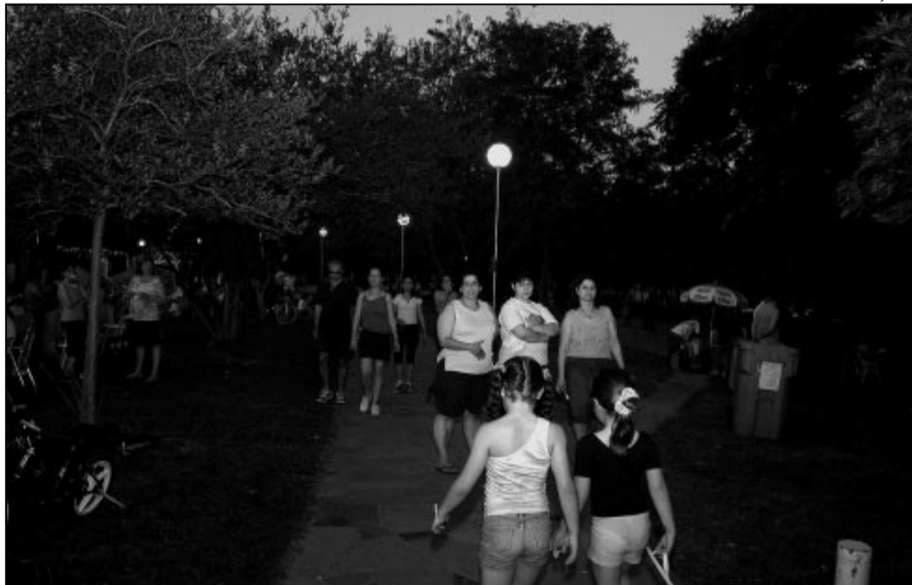
Iniciativa significa mais lazer e segurança para a população