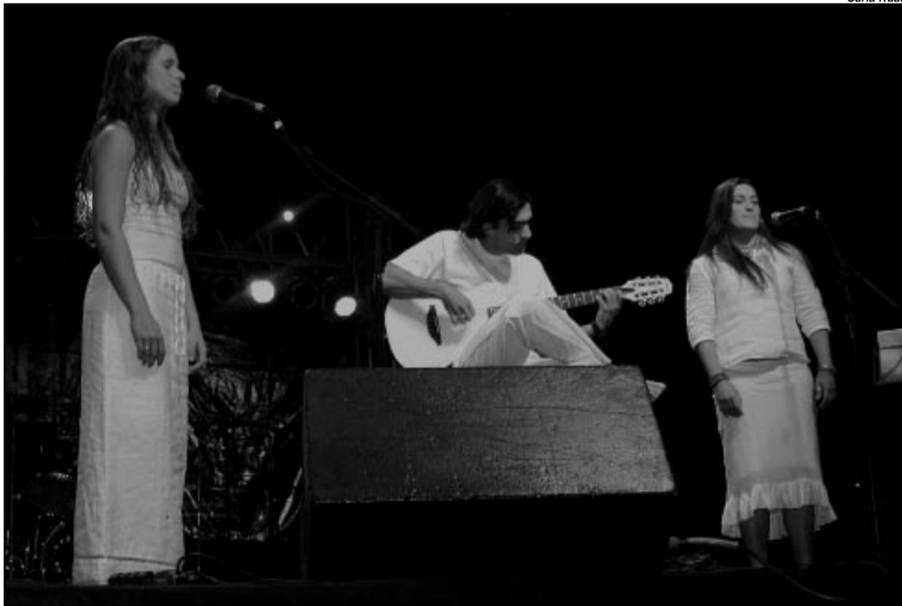
Concurso de composições inéditas estimula o surgimento de talentos locais